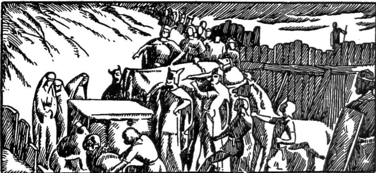
Bestattung Alarichs im Busento.