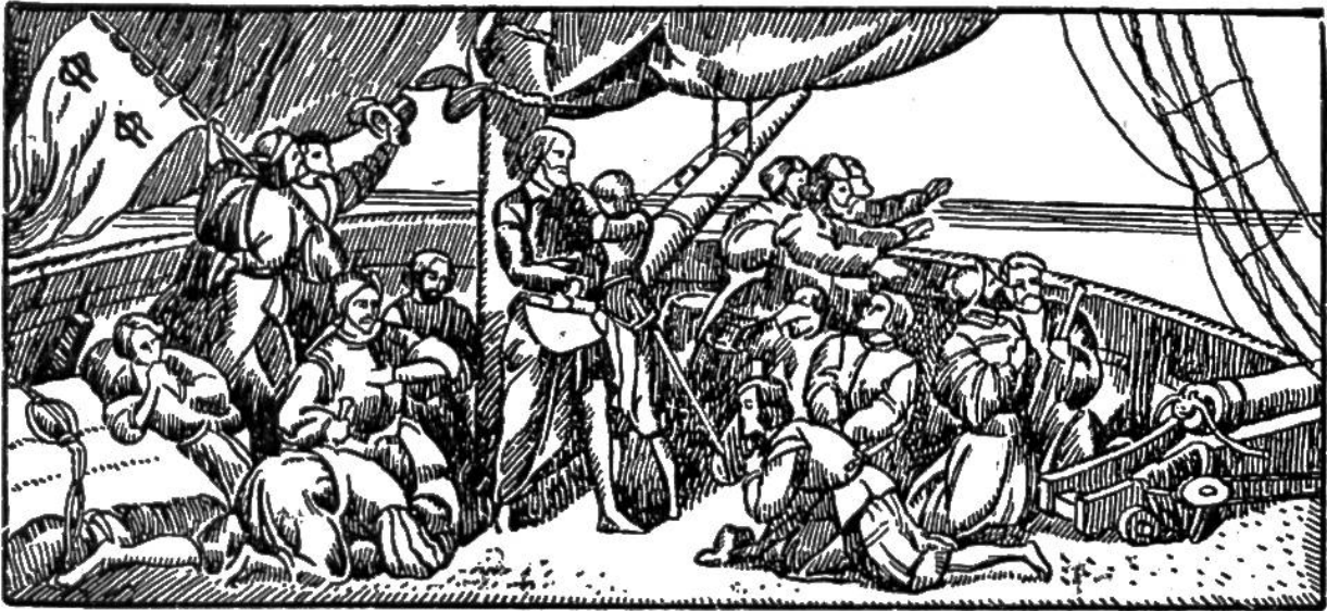
Kolumbus und seine Gefährten sichten Land.