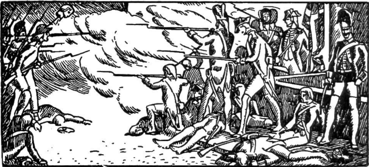
Verteidigung der Tuileries durch die Schweizergarde.

1756—1763 Siebenjähriger Krieg. Preussen behält Schlesien. Frankreich tritt Kanada an England ab. 1761 Gründung der Helvetischen Gesellschaft. Iselin, Balthasar, Hirzel, Zimmermann, Salis, Haller, Gessner, Lavater, Pestalozzi, Johannes v. Müller. 1766 Lothringen und Korsika werden französisch.