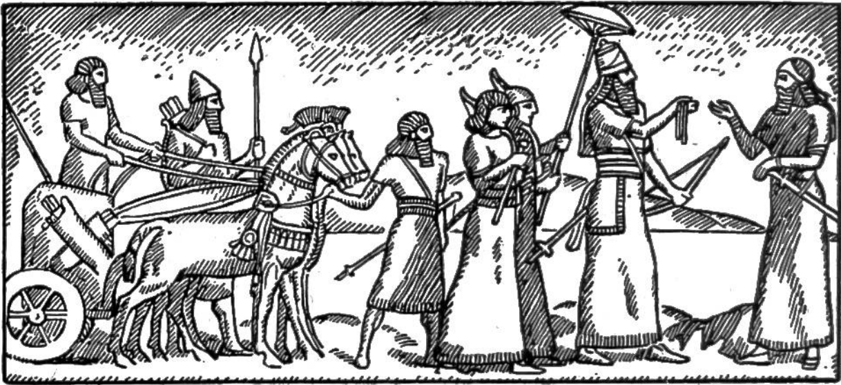
Assyrischer König mit Gefolge.