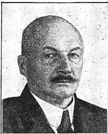
Dr. Albert Meyer von Fällanden (Zürich) *1870, seit 1930 i. Amte

Dr. Motta: Chef d. Politischen Departements. Dr. Meyer: Chef des Departements des Innern. Dr. Häberlin: Chef des Justiz- u. Polizeidepartements. Minger: Chef d. Militärdepartements. Dr. Musy: Chef des Finanz- und Zolldepartements. Dr. Schulthess: Chef des Volkswirtschaftsdepartements. Dr. Pilet: Chef d. Post- u. Eisenbahndepartements