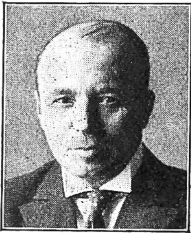
Dr. Jean Musy von Albeuve, Freiburg *1876, seit 1920 i. Amte