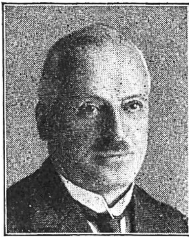
Dr. Giuseppe Motta von Airolo *1871, seit 1912 i. Amte