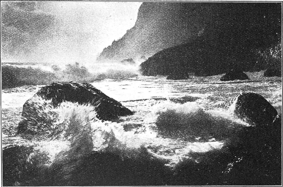
Meeresbrandung auf Capri (Italien).