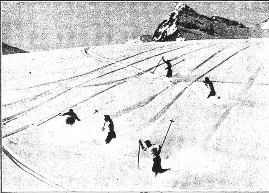
Pulverschnee. Mühelos zieht der Skifahrer seine Telemark-Schwünge in die aufstiebende, weisse Pracht.

Pulverschnee. Tritt nämlich nach Neuschnee- fall Frost ein, so wird der Schnee leicht und pulverig. Gewöhnlich ist Neuschnee erst nach 2—3 Tagen prima „skifertig“. Dann ist er genügend ausgekaltet und hat sich gesetzt, das Ideal für den Telemarkspezialisten. Kühn zieht er seine eleganten Schwünge mühelos in die aufstiebende Herrlichkeit. Aber auch für den Skisäug- ling wie für das Skibaby bietet der Pulverschnee das Ideal des „skirechten“ Schnees. Die Hölzer haben eine tadellose Führung und speziell das Fallen ist „viel an- genehmer“.