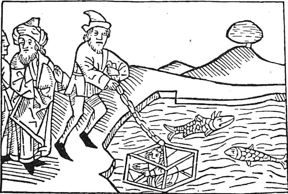
Wiederum der Taucherversuch Alexanders des Grossen in anderer Darstellung. (Beide Darstellungen nach mittelalterlichen Buchillustrationen.)

Beschreibungen von ähnlichen Taucherausrüstungen liefert schon der griechische Philosoph Aristoteles, 350 v. Chr. Sehr viel beschäftigte sich der geniale Maler und Erfinder Leonardo da Vinci mit der Konstruktion