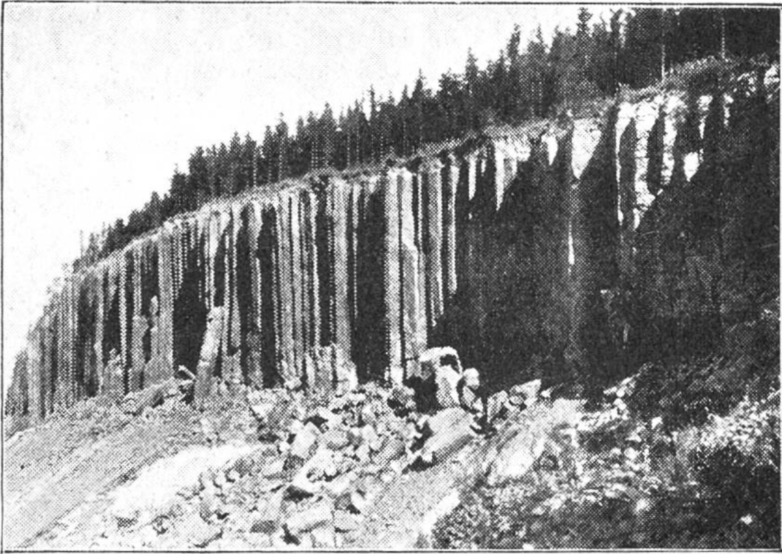
„Die Orgelpfeifen“. Basaltsäulen im Erzgebirge, die früher als Steinbruch benutzt wurden, jetzt aber unter Naturschutz gestellt sind.

bildeten, türmten sich die Basaltmassen zu kegelförmigen Bergen auf. Das Merkwürdige ist, dass dieser Basalt, vielleicht infolge rascher Abkühlung, oft die Gestalt von ziemlich regelmässigen Säulen annahm. Der ganze Vulkankegel schichtet sich dann aus derartigen Säulen auf. Dort, wo der Basalt in Steinbrüchen gewonnen wird, ist das ein Vorteil. Aber nicht jeder Basalt ist so hart, dass sich der Abbruch lohnte. Manche Sorten verwittern rasch, andere dagegen geben ein vorzügliches Strassenpflaster. Basaltsäulen messen im Durchmesser meist etwa 25 cm. Die Säulenhöhe ist verschieden.