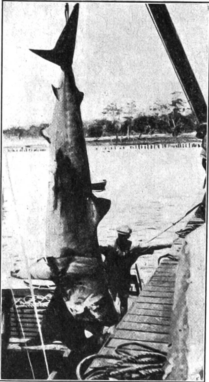
Die gewichtige Beute wird an Bord des Haifischfängers hochgezogen.

Hautstücke mit ihren rauhen Schuppen dienen, gleich dem Glaspapier, zum Glätten von Holz; abgeschuppt jedoch wird die Haut gegerbt und ergibt ein äusserst dauerhaftes Leder, das sich besonders auch zum Bespannen von Autokarosserien eignet. Die Zähne sind in der Südsee ein beliebter Schmuck und können da im Tauschhandel geradezu als Geld gebraucht werden. Die Leber liefert reichlich Tran, für den die Industrie mannigfache Verwendung hat. Wenn sogar Knochen, Blut und die Eingeweide