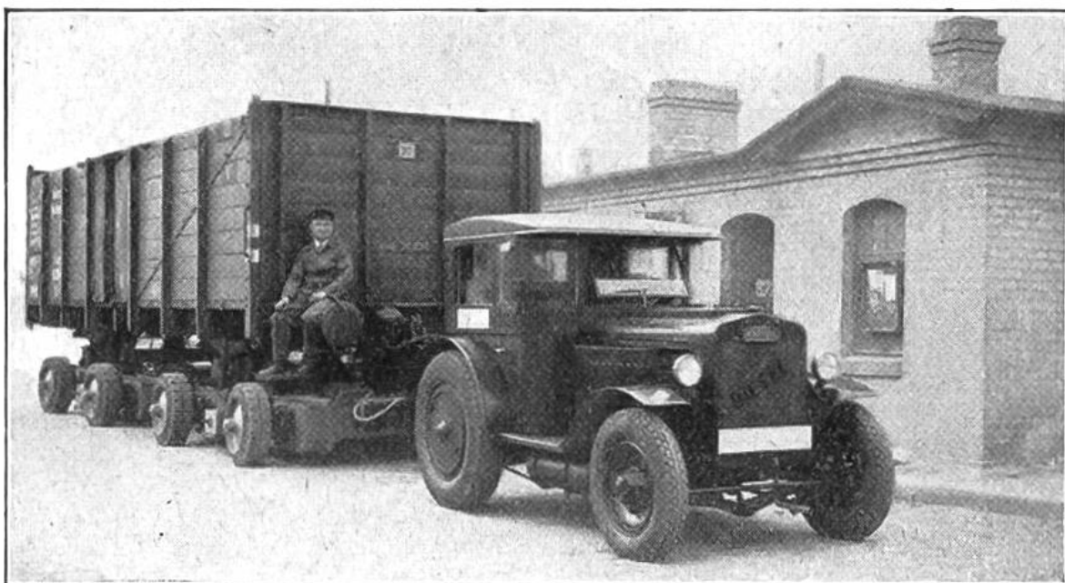
Ein Traktor zieht das Fahrgestell, das mit einem Güterwagen beladen ist, durch die Strassen vom Bahnhof zum Lagerhaus.

selbst Automobile in ihren Dienst gestellt, um an den Bahnhöfen Zu- und Abfuhr zu besorgen. Aber dies hat bei Gütersendungen immer noch den Nachteil, dass die Ware zweimal umgeladen werden muss; das ist zeitraubend und teuer und verlangt auch eine kostspieligere Verpackung. Im Auto kann selbst brüchige Ware lose, in Stroh gebettet, an den Bestimmungsort gebracht werden. Um den gleichen Vorteil bieten zu können, hat die Eisenbahn in Deutschland und anderswo eine Neuerung eingeführt: „Das fahrende Geleise“. Die fahrbaren Schienenstücke befinden sich auf einem niedrigen Strassenfahrzeug. Der Frachtwagen wird darauf geschoben, ein Traktor vorgespannt, und dann fährt der Bahnkoloss auf der alten, guten Landstrasse direkt zur Ein- oder Abladestelle. So muss also selbst die mächtige Eisenbahn heute vielen ihrer Kunden nachgehen, weil diese sonst nicht zu ihr kommen.