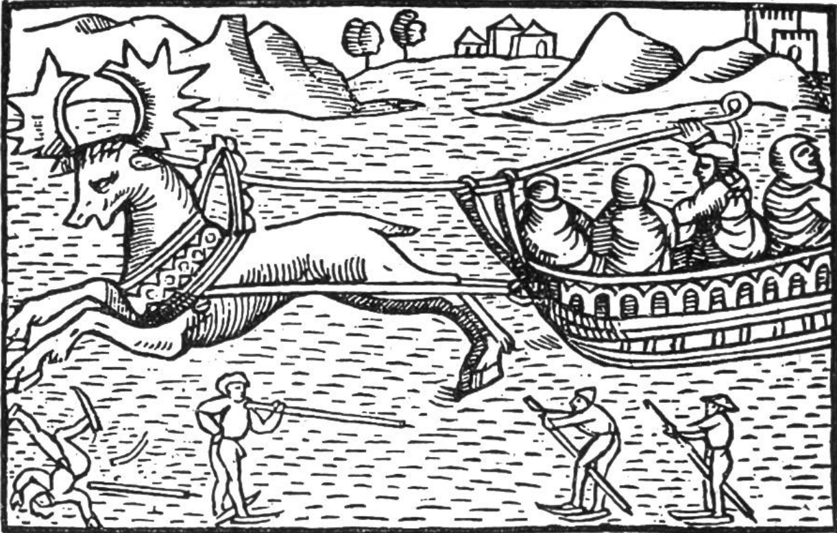
Von einem Elche gezogener Schlitten und Skifahrer. (Aus dem Buche von Olaus Magnus, 1567, Basel.)

hier erzählt wird, hat sich in Wirklichkeit diese „Erfindungsgeschichte“ kaum abgespielt. Aber ungefähr in dieser Weise hat man sie sich vorzustellen. Jedenfalls haben die Forscher derartige Skier bei fast allen Naturvölkern der sogenannten subarktischen Zone, nämlich in Nordrussland, Sibirien und Lappland entdeckt. Bei den Jägern Koreas haben solche Skier auch sommers gute Dienste geleistet beim Durchschreiten der vielen Sümpfe des Landes.