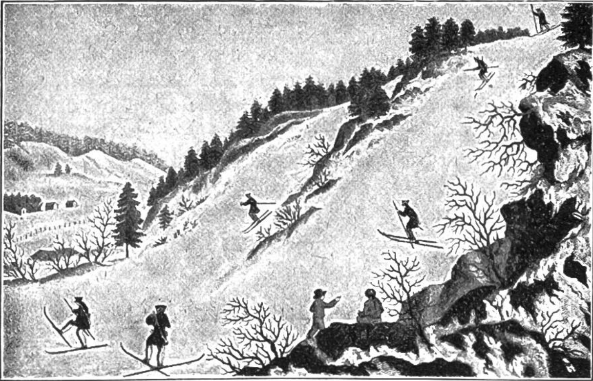
Norwegische Militär-Skiläufer im 18. Jahrhundert. (Nach einem alten Stich.)

überhaupt zwei verschiedene Skiarten zu einer einzigen vereinigt. Die alten skandinavischen Skier waren nämlich ungleich lang. Der rechte mass gegen 3,3 m, der mit Pelz überzogene linke dagegen höchstens 2,1 m. Dieser linke Ski diente bloss zum Abstossen; der rechte dagegen trug das Körpergewicht. Das Laufen mit solchen Skiern ist am ehesten dem Trottnet-fahren (Roller) der Kinder zu vergleichen. Der rechte gleitende Ski hatte jene Rinne auf der Unterseite, wie sie auch die modernen Skier durchwegs an beiden aufweisen. Die letzten Läufer auf solchen ungleichpaarigen Hölzern wurden vor noch nicht langer Zeit in Norwegen gefilmt zur Erinnerung an diese Art des Skilaufs. Noch vor 100 Jahren waren die berühmten norwegischen Skikompanien zum Teil mit solchen ungleichen Brettern ausgerüstet.