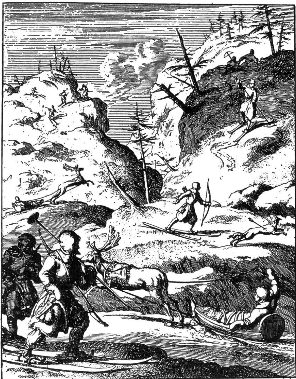
Lappländische Jäger, auf Skiern und in Renntierschlitten. (Nach einem holländischen Kupferstich aus dem Jahre 1682.)