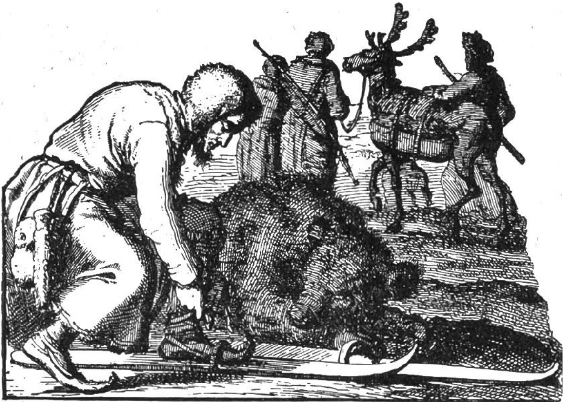
Lappländischer Skifahrer auf der Bärenjagd, mit erlegtem Bär. Zeichnung aus dem Jahre 1682.

Völker“ geben wir einige Bilder wieder. Olaus Magnus erzählt auch von regelrechten Skirennen der Lappen. Er schreibt vom Skilaufen: „und solches thuen sie bissweilen auss Lust zu jagen, bissweilen, dass sie mit eynander wetten, und eyn jeder der best sein will, gleich wie man sonst auf der ebenen Erde mit eynander in die Wette läuft“.