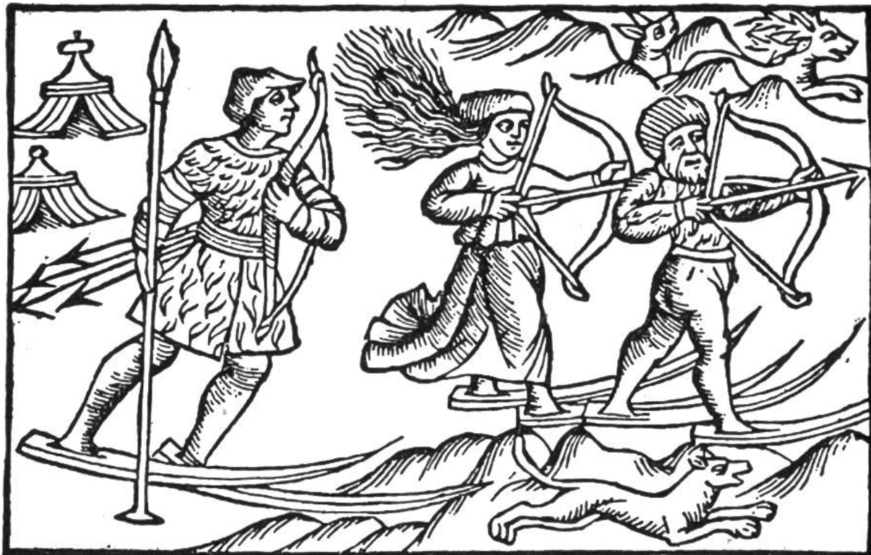
„Wildt-Lappen“ auf der Jagd. (Aus dem Buche des Olaus Magnus, 1567, Basel.)

Bretter jung und alt erfasste, da begann man nicht allein die Skisprünge, sondern auch die Ursprünge des Ski genauer zu erforschen. Da zeigte sich denn, dass dieses wundervolle Fahrzeug, — die Bretter „die den Schnee besiegen“ — schon einige tausend Jahre alt ist, und dass die Skier in verschiedenen Ländern unabhängig voneinander erfunden wurden. Gar viele Völker hatten in ihren schneereichen Ländern zur Winterszeit einen harten Kampf ums Dasein auszufechten; die mit Pfeil und Bogen ausgerüsteten Jäger vermochten bei lockerem Schnee dem flinkerem Wild nicht mehr zu folgen. Sie alle machte die Not erfindetisch. So wurde denn ein uraltes Verkehrsmittel, nämlich der Schuh, den Verhältnissen auf dem Schnee angepasst. Um das Einsinken zu verhindern, wurden die Sohlen „einfach verlängert“, und zwar mit Brettern oder fellbespanntem Flechtwerk. Aus dem Schreiten wurde ein Gleiten, und so ward ein neues Verkehrsmittel, eine Art Ski, erfunden. Ganz so einfach wie