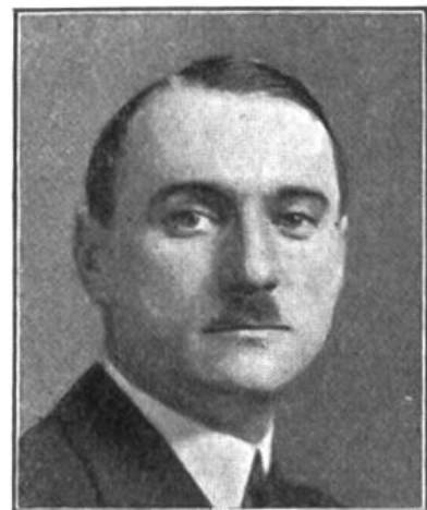
Dr. M. Pilet-Golaz von Château-d'Oex *1889, seit 1929 i. Amte