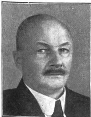
Dr. Albert Meyer von Fällanden (Zürich) *1870, seit 1930 i. Amte

Dr. Motta: Chef d. Politischen Departements. Dr. Meyer: Chef des Finanz- u. Zolldepartements. Dr. Baumann: Chef d. Justiz- u. Polizeidepartements. Minger: Chef des Militärdepartements. Dr. Schulthess: Chef d. Volkswirtschaftsdepartements. Dr. Pilet: Chef des Post- und Eisenbahndepartements. Etter: Chef des Departements des Innern.