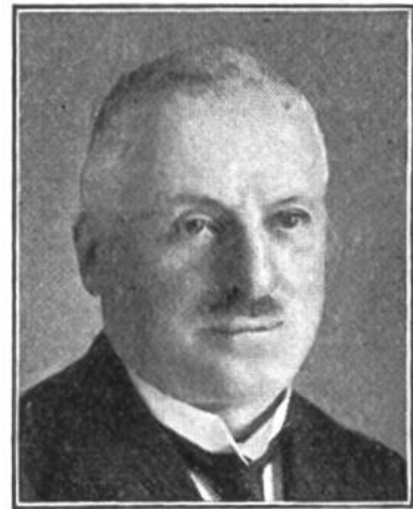
Dr. Giuseppe Motta von Airolo *1871, seit 1912 i. Amte