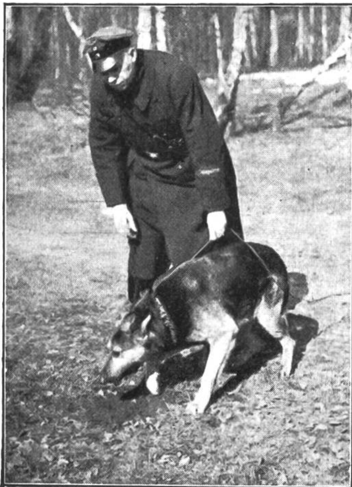
Der Führer setzt (bei einer Übung) den Hund zum Finden einer Spur an.