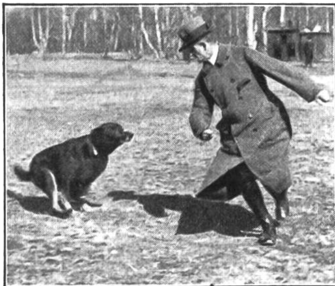
Bild unten : Polizeihund geht zum Angriff auf einen verfolgten Flüchtling über.

zieht die Polizei hauptsächlich deutsche Schäferhunde (Wolfshunde), Dobermannpinscher, Airedale-Terrier und Rottweiler oder Sennehunde heran, alles Vertreter von mittelgrossen, besonders kräftigen Rassen.