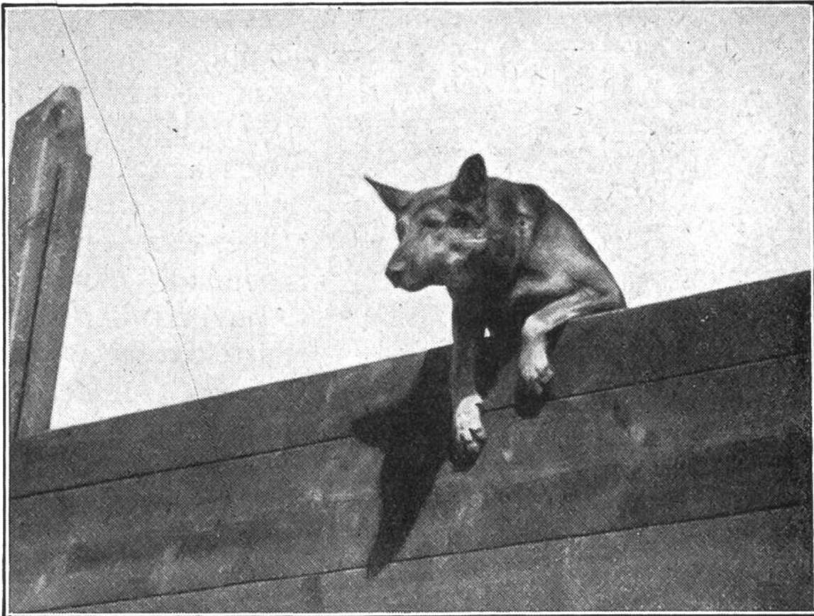
Ein Diensthund (deutscher Schäfer) nimmt elegant ein Hindernis: 2\frac{1}{2} m hohe Ladenwand.