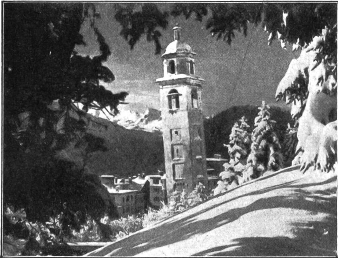
Der schiefe Kirchturm von St. Moritz, erbaut im Jahre 1573.

Jahren der Untergrund des Turmes gegen das Wasser abgedichtet und zementiert worden, so dass das „unfreiwillige Wunder der Baukunst“ noch Jahrhunderte überdauern dürfte.