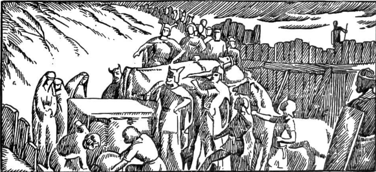
Bestattung Alarichs im Busento.