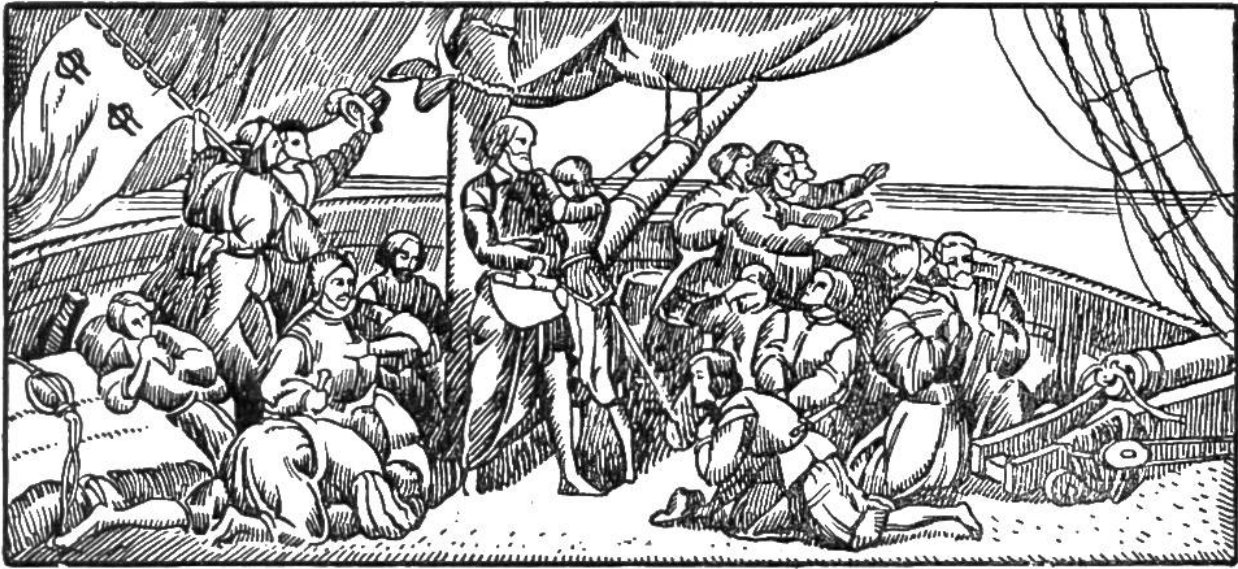
Kolumbus und seine Gefährten sahen Land.