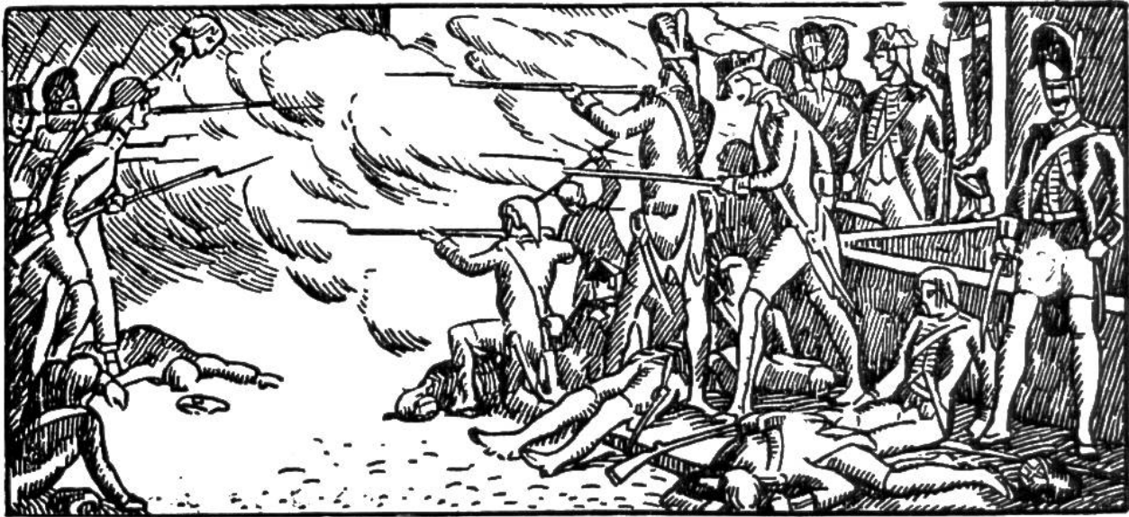
Verteidigung der Tuileries durch die Schweizergarde.

1756–1763 Siebenjähriger Krieg. Preussen behält Schlesien. Frankreich tritt Kanada an England ab. 1761 Gründung der Helvetischen Gesellschaft. Iselin, Balthasar, Hirzel, Zimmermann, Salis, Haller, Gessner, Lavater, Pestalozzi, Johannes von Müller. 1766 Lothringen und Korsika werden französisch.