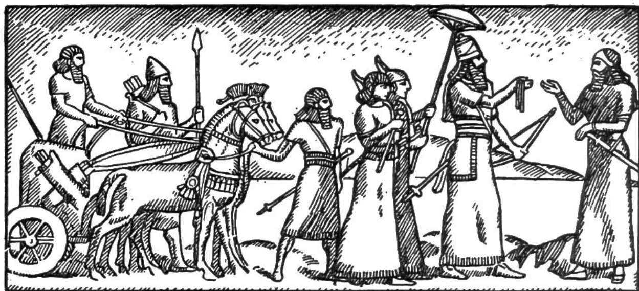
Assyrischer König mit Gefolge.