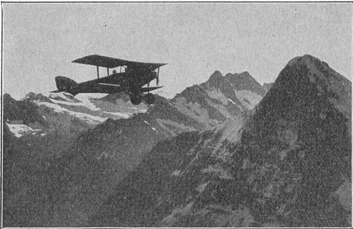
Flugzeug über Eiger und Schreckhörner in 4000 Meter Höhe.