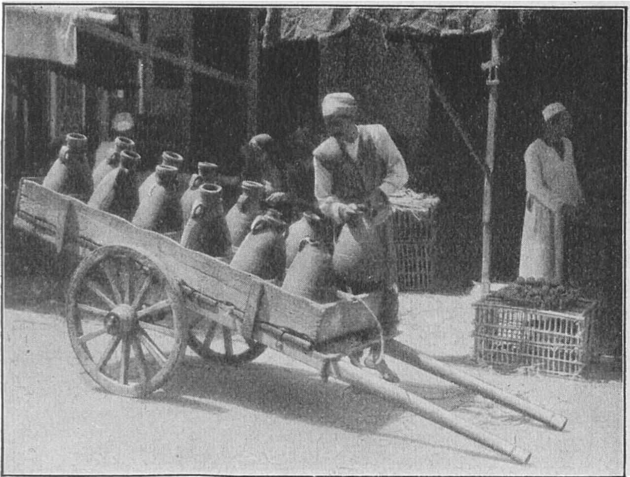
Ein Wasserverkäufer führt seine Ware in den schon im Altertum bekannten, unglasierten Tonkrügen durch die Strassen von Port Said (am Suez-Kanal).

führt. Doch in Ägypten, in Nordafrika, in Kalifornien, in Australien spielt die Bewässerung noch eine viel grössere Rolle. In jenen Ländern wäre ohne sie vielerorts überhaupt keine Bodenkultur möglich. Schon die alten Ägypter waren wahre Bewässerungskünstler, und auch die Mauren hatten diesen Ruf. In moderner Zeit wurde in den Vereinigten Staaten sowie in den englischen und französischen Kolonien in dieser Hinsicht Grosses geleistet. In trockenen Gegenden bietet auch die Versorgung mit Trinkwasser enorme Schwierigkeiten. So muss die amerikanische Stadt Los Angeles ihr Wasser fast 400 Kilometer weit herleiten. Trinkwassersorgen hat man auch in den Tropen, denn dort ist das Wasser für gewöhnlich nur dann gesundheitlich einwandfrei, wenn es vorher gekocht wird.