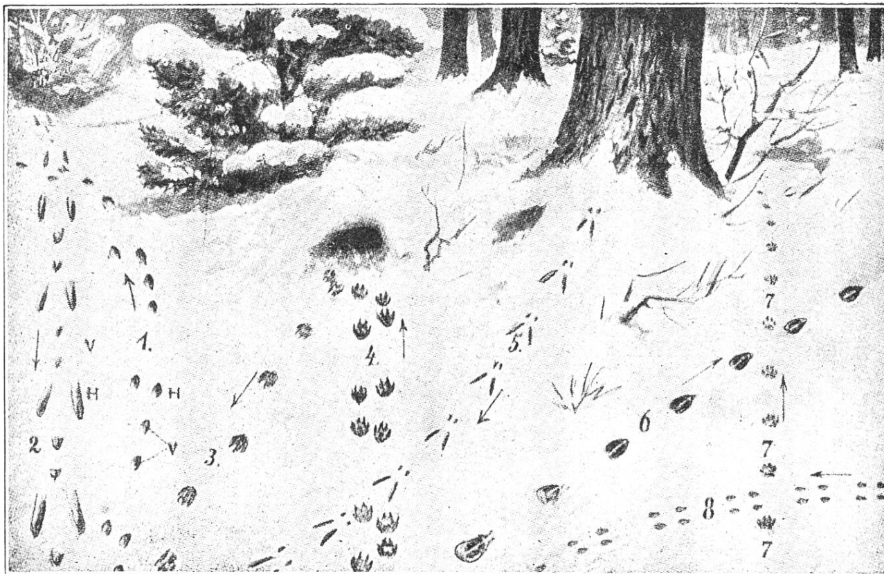
Wildfährten: Spuren im Schnee. 1. Fluchtspur des Hasen. 2. „Das Hoppeln“ des Hasen. 3. Die Fährte des Fuchses. 4. Fluchtspur des Fuchses. 5. Eichhörnchen. 6. Reh. 7. Wildkatze. 8. Hermelin. V = Vorderfüsse. H = Hinterfüsse.