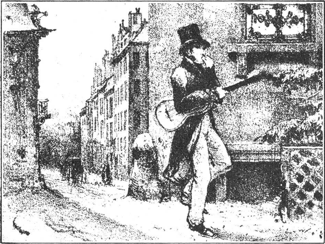
Der frierende Musikant.