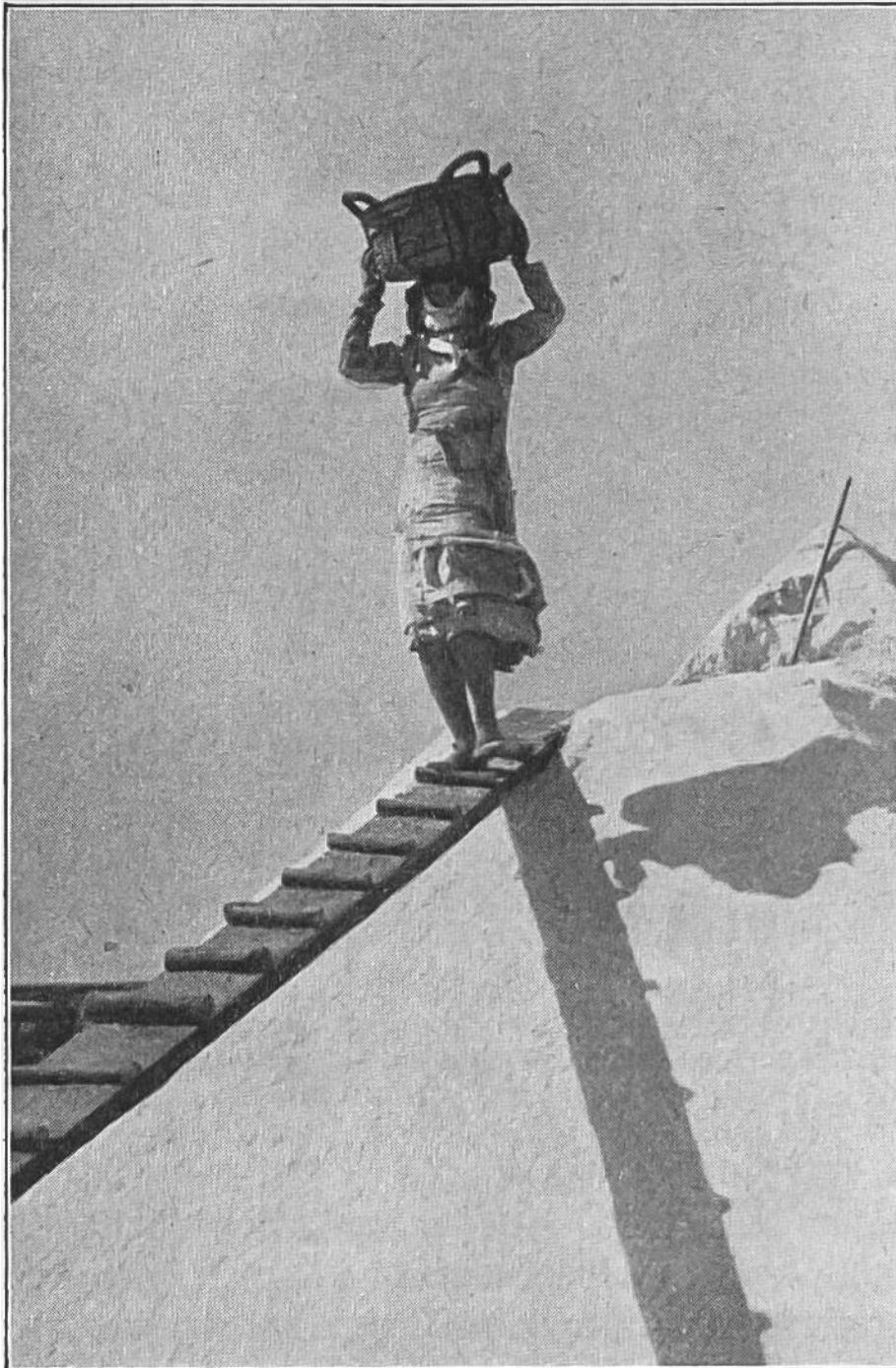
Salzmädchen beieiner schweren Arbeit, in glühender Sonne das Salz von den „Pfannen“ auf die Vorrats- berge zu tragen. Unzählige Male des Tags geht es den Weg hin und zurück.

Salz. Im Erdboden findet es sich und in sprudelnden Salzquellen; aber der größte Salzlieferant ist das Meer. Bei der Gewinnung des Salzes, das der Ozean uns spendet, leistet die Sonne mit ihrer starken Verdampfungskraft die Hauptarbeit. An den Küsten südlicher Länder mit trockenen, heißen Sommern (in Europa: Spanien, Portugal, Südfrankreich) werden eine Anzahl Staubecken, die sogenannten Pfannen, gegraben. Durch Kanäle leitet man die Meeresfluten in jene flachen, auszementierten Becken. Und nun kann Frau Sonne mit Kochen beginnen. Tag um Tag brennt