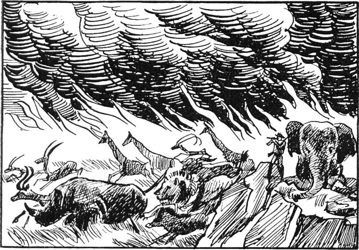
Der Jäger sieht von der Felshöhe herab, wie die Tiere der Steppe vor dem rasenden Feuer flüchten.

auf das Flammenmeer zu. Er durchquert eine Bodenmulde und rast eine Anhöhe hinauf — einen felsigen Hügel. Von seinem sichern Instinkt geleitet, hatte das Tier diese steinige Insel gefunden, die vor den Flammen Schutz bot.