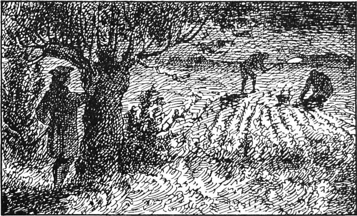
Der in der Nacht hinter einem Baum versteckte Parmentier freut sich, dass ihm seine Kartoffeln gestohlen werden.

zum grössten Teil. Auch Ärzte warnten vor dem Genuss von Kartoffeln, weil die Pflanze, wie die Tollkirsche und verschiedenes Giftkraut, der Familie der Nachtschattengewächse angehöre. Nicht erwähnt wurde dabei, dass diese Familie etwa 1800 Arten umfasst und dass ihr auch Pfeffer, Süssholz und die nahe Verwandte der Kartoffel, die Tomate, angehören. Allerdings ist wahr, dass alle grünen Teile der Pflanze einen Giftstoff enthalten und dass sich ein solcher auch in den Keimen, die im Frühjahr aus den Knollen spriessen, bildet. Wenn auch dieser Giftstoff auf den Menschen nicht tödlich wirkt, so ist er doch nicht bekömmlich. Die Knolle aber, die der Mensch einzig geniesst, hat nur nützliche Eigenschaften. Zur Zeit der grossen Hungersnöte von 1793 und 1817 vergass man wieder die üble Nachrede von der Giftigkeit der Kartoffel und begriff endlich allgemein ihre grosse Bedeutung als Volksnahrungsmittel. Einer, der das am besten einsah, war Napoleon I. Er ernannte den grossen Physiker Volta von Como zum Grafen, nicht etwa wegen seiner Entdeckungen auf dem Gebiete der Elektrizität — die erschienen damals noch nicht so bedeutsam —, sondern