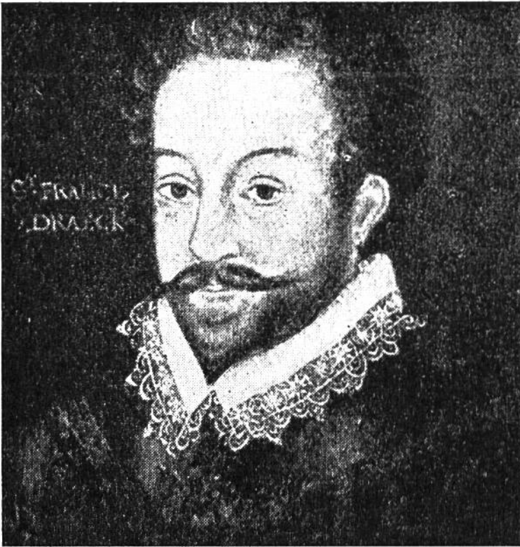
Der englische Seeheld Francis Drake, der auch 1577 die Welt umsegelte, war einer der ersten, der in England Kartoffeln auf Feldern seiner Landgüter anpflanzen liess.

friedlicher mit den Indianern umgegangen, so hätten sie wohl auch von ihnen erfahren, welche gewaltige Bedeutung der Kartoffelpflanze zukommt; so aber dauerte es Jahrhunderte, bis es die Europäer selbst herausfanden; inzwischen mussten sie manche fürchterliche Hungersnot über sich ergehen lassen. Im Laufe der Jahrzehnte kam die Kartoffel von Spanien nach Italien und von dort nach Frank-