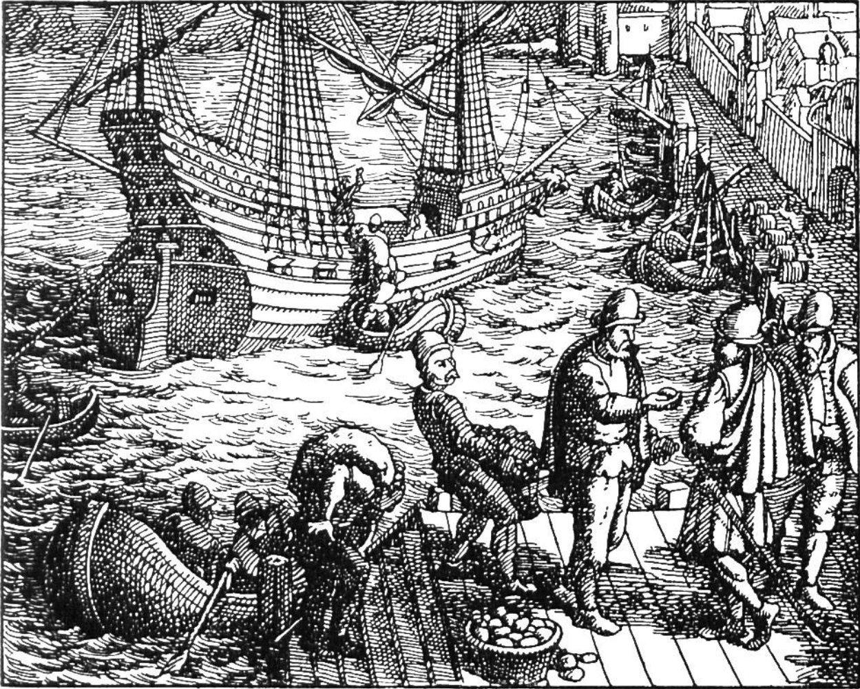
Englische Seefahrer bringen Kartoffeln aus dem neuentdeckten Erdteil.

dische Botaniker Linné aus Bauhins grossem Pflanzenwerk. Leider sind wir Schweizer undankbar gegen unsere Gelehrten und bedeutenden Männer. Wir lassen sie in Vergessenheit geraten.