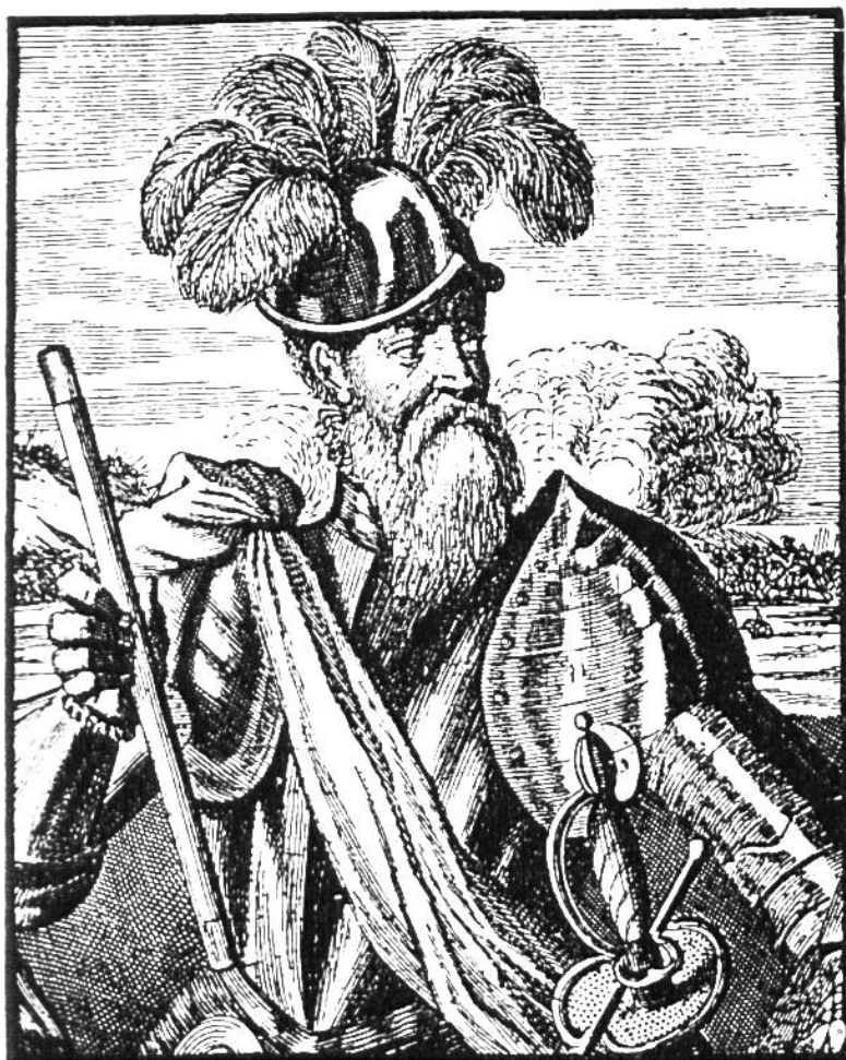
Der ehemalige Schweinehirt Pizarro, Anführer der goldgierigen spanischen Horde, die Peru eroberte und das Inkareich zerstörte.

und wenig schmackhaft. Die südamerikanischen Indianer haben die Kartoffel in Äckern angepflanzt und wohl während Jahrtausenden gezüchtet und veredelt. Die Pflanze stand bei den Indianern in hohem Ansehen; man gab Verstorbenen Kartoffeln mit ins Grab; die Kartoffel wurde auch als künstlerisches Motiv verwendet; aus der Zeit vor der Entdeckung Amerikas sind uns Tonkrüge in Kartoffelform erhalten geblieben.