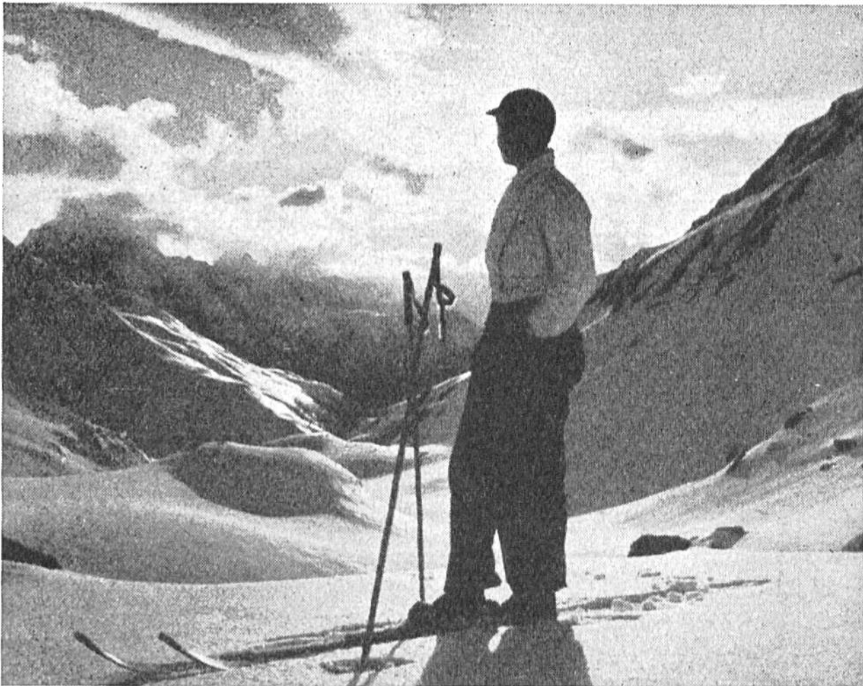
Im Banne der Landschaft. Ein prächtiger Wintertag im Hochgebirge, Sulzschnee und wechselndes Spiel der Wolken.

Im Berner Oberland wurde erstmals im Januar 1897 eine grössere Skitour ausgeführt. Vier Touristen aus Strassburg und Freiburg i. Br. wanderten innert sechs Tagen von Guttannen im Haslital über den Unter- und Oberaar-gletscher und den grossen Aletschgletscher ins Rhonetal. Es dauerte aber noch fast ein Jahrzehnt, bis man nach richtiger Anleitung die Vorteile des Skifahrens und des Wanderns im Winter schätzen lernte. In den letzten dreissig Jahren ist dann der Ski Allgemeingut geworden und damit auch das Wissen um Winterpracht und Winterfreuden. Hunderttausende ziehen Jahr für Jahr in die Schweizerberge und finden in reiner Winterluft Erholung und neue Lebenskraft. — Winterkuren und Wintersport haben überdies der einheimischen Fremdenindustrie eine neue Grundlage gegeben, ohne welche sie heute nicht mehr bestehen könnte.