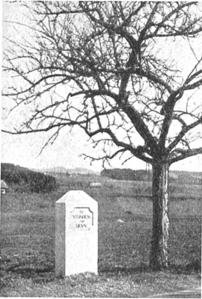
Stundenstein der alten Republik Bern. Er gibt die Entfernung von Bern an. (Eine Wegstunde = 4,8 km.)

zu stossende Vorrichtung war grundsätzlich gleich konstruiert wie die römischen Wegmesswagen. Beim englischen Wegmesser gab ein Zeiger auf einem Zifferblatt die Zahl der Radumdrehungen an. Es konnte also in jedem Augenblick festgestellt werden, welche Strecke seit dem Ausgangspunkt zurückgelegt worden war. Das 1. Bild zeigt einen nach dem gleichen Prinzip arbeitenden Wegmesswagen aus dem 17. Jahrhundert. Man erkennt das Zifferblatt des Wegmessers hinter dem Kutschersitz. Aus der jederzeit ersichtlichen Länge der zurückgelegten Strecke liess sich die Fahr-taxe berechnen. Der moderne Taxameter, der, wie unser 5. Bild beweist, trotz seiner unscheinbaren Grösse eine komplizierte mechanische Vorrichtung enthält, gibt direkt und fehlerfrei den für die Fahrt zu entrichtenden Betrag an. Heute ist in jedem Automobil ein Kilometer-Zähler eingebaut, der zur gleichen Zeit das Total der gefahrenen Kilometer, die jeweilige Geschwindigkeit in Kilometer und die