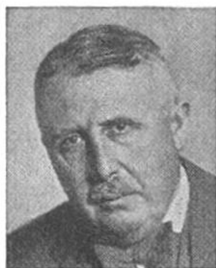
Eduard v. Steiger von Bern * 1881, seit 1941 im Amte Justiz- u. Polizeid.