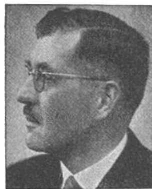
Dr. Karl Kobelt von Marbach (St. G.) * 1891, seit 1941 i. Amte Militärdepartem.