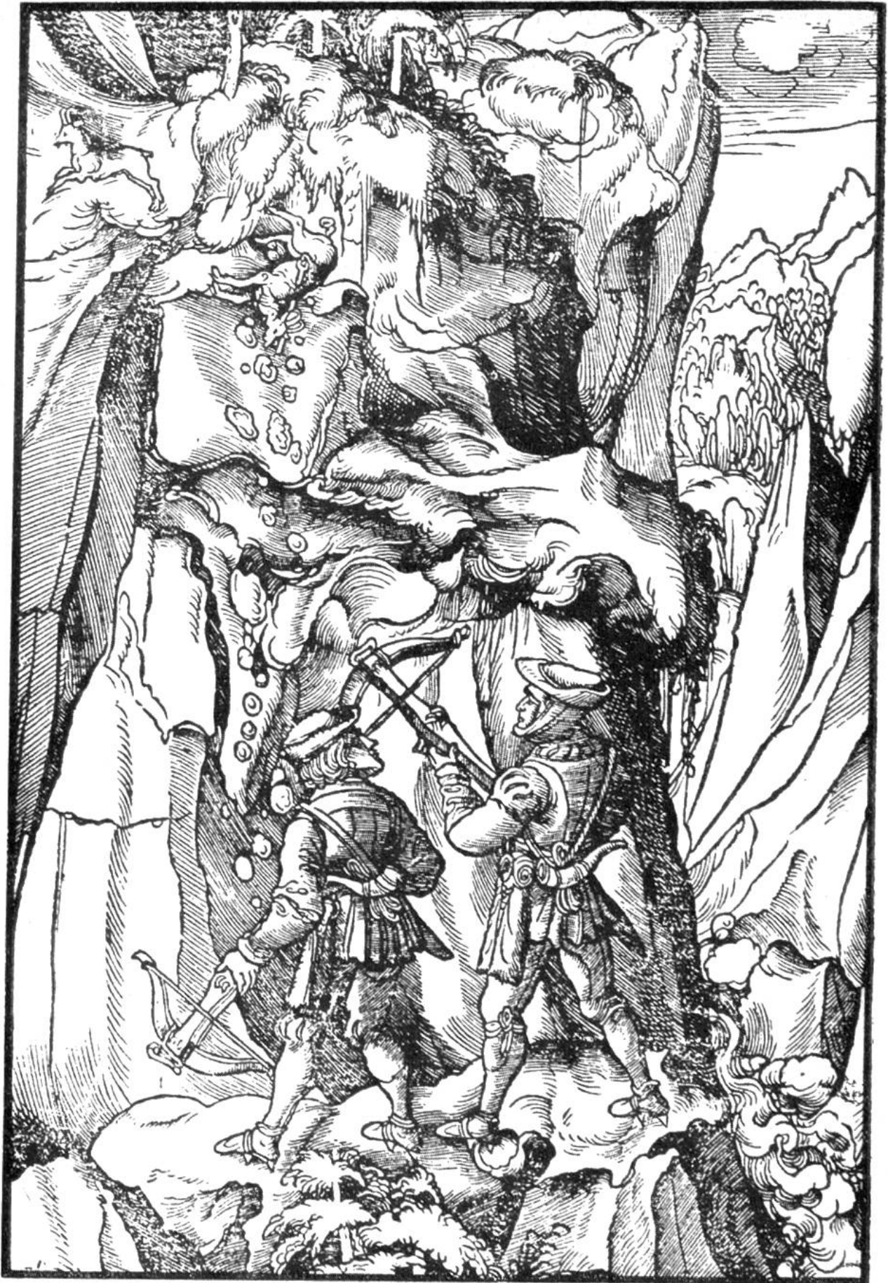
AUF DER GEMSJAGD Holzschnitt von Hans Burgkmair.