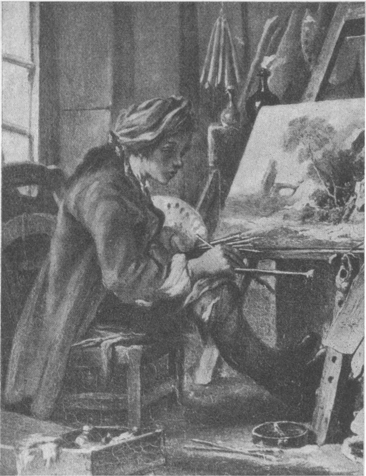
FRANÇOIS BOUCHER IN SEINEM ATELIER Selbstbildnis.