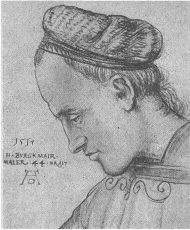
Selbstbildnis des Künstlers. (Dürer-Monogramm später hinzugefügt.)