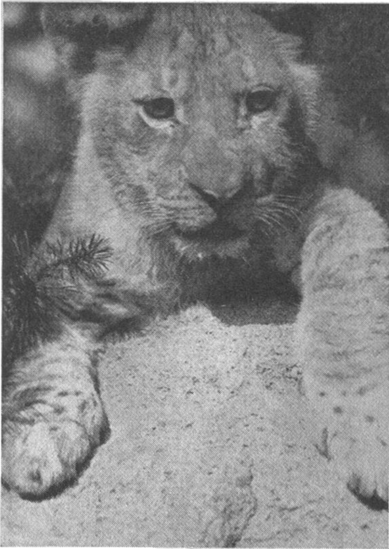
Junglöwe, an dessen Pfoten noch die Fleckung des Jugendkleides sichtbar ist.

will; jedem ist seine ganz bestimmte gesellschaftliche Stellung zugeordnet und dieser strengen Rangordnung entsprechend hat sich jeder aufzuführen. Auch die Zusammenfindung der Paare ist meistens nur möglich auf Grund von Kämpfen, welche die Rivalen unter sich auszufechten haben. Mit alledem soll nur gezeigt werden, dass der Löwe im Freileben ein Tier wie ein anderes ist. Er hat keine besonders bevorzugte Stellung, sondern er ist gleichfalls dem schweren,