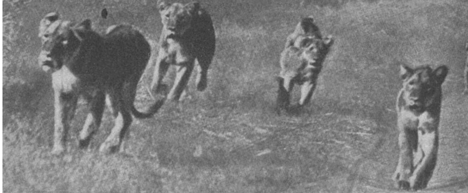
Eine Gruppe halbzahmer Junglöwen in einem afrikanischen Wildreservat.