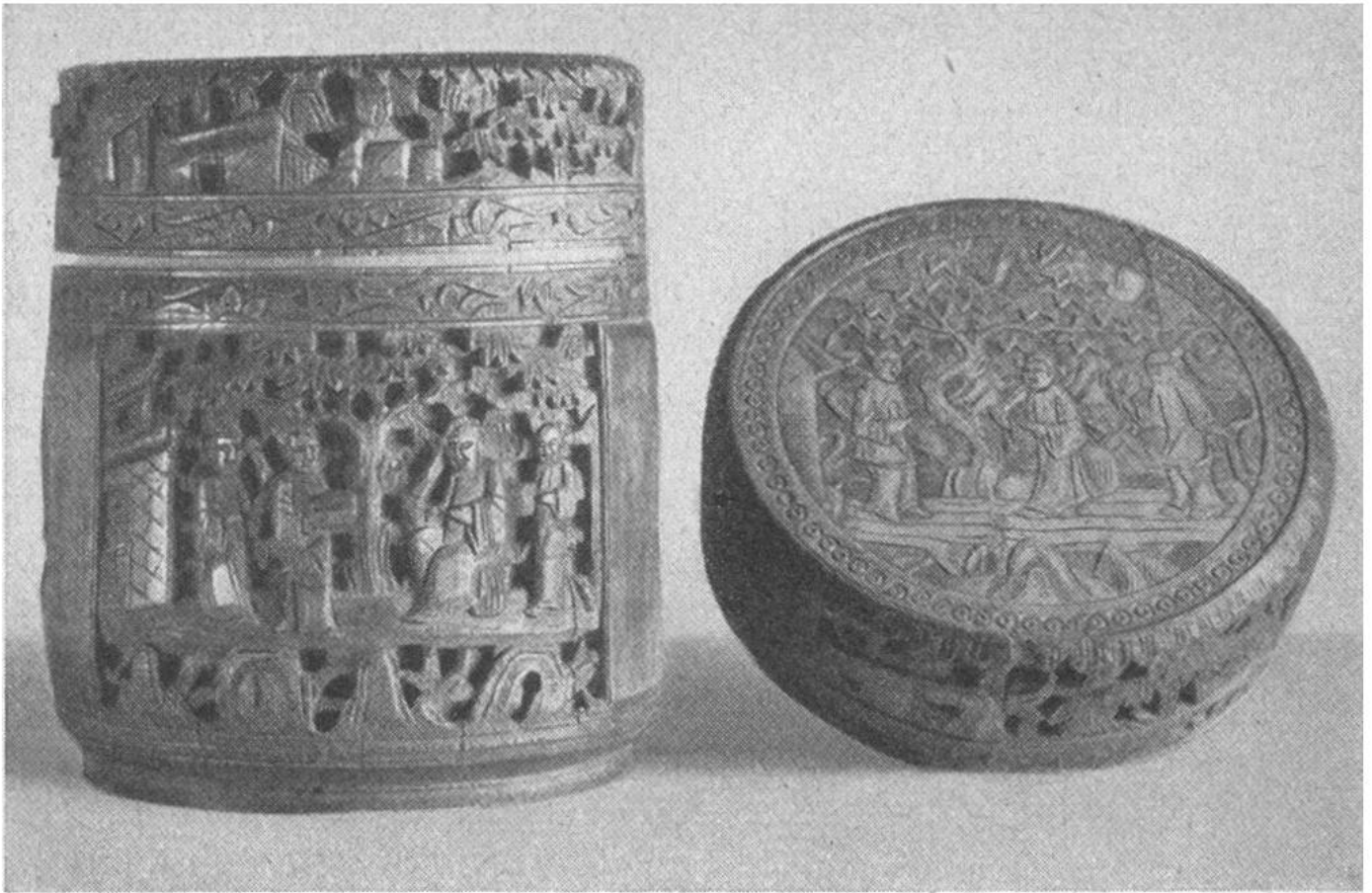
Grosses alt-chinesisches Gefäss aus Bambus, reich geschnitzt, mit figürlichen Darstellungen; rechts: Übersicht des Deckels der Dose.