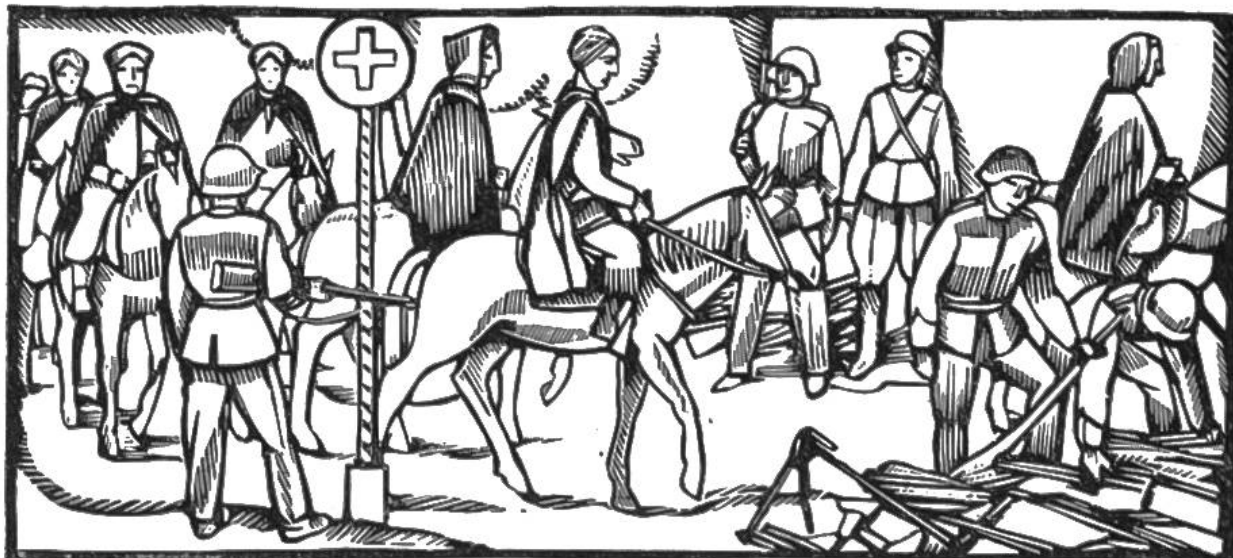
Im Juni 1940 überschreiten nahezu 40 000 alliierte Truppen die Schweizergrenze. Waffenabgabe der Spahis im Berner Jura.

slawien u. Griechenland. In Abessinien erobern die Engländer Addis-Abeba. 9. April: Die Schweizerflagge wird als «Hoheitszeichen zur See» anerkannt; Schweizer Schiffe befahren die Weltmeere. 13. April: Deutsche Truppen in Belgrad. 17. April: Kapitulation d. jugoslaw. Armee. 21./23. April: Die griechischen Armeen in Epirus und Mazedonien kapitulieren. 25. April: Rückzug der britischen u. griechisch. Truppen nach Kreta. 27. April: Einmarsch der Deutschen in Athen. 3. Mai: Beginn des irakischen Konfliktes (1. Juni: Waffenstillstand). 18. Mai: Proklamation des Herzogs v. Spoleto (Sohn des Königs v. Italien) zum König von Kroatien. 20. bis 30. Mai: Einnahme Kretas durch deutsche Fallschirm- und Luftlandetruppen. 4. Juni: † Ex-Kaiser Wilhelm II. in Doorn. 8. Juni: England dringt in Syrien (franz.) ein. 22. Juni: Deutschland u. Italien erklären Russland den Krieg.