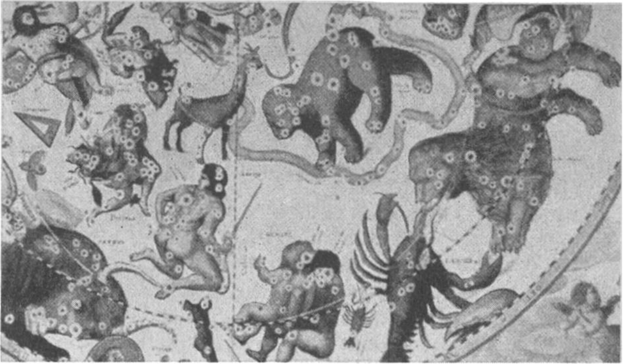
Teilstück einer Sternkarte aus dem Jahre 1660. Vor lauter Bildern erkennt man die Sterne kaum mehr.