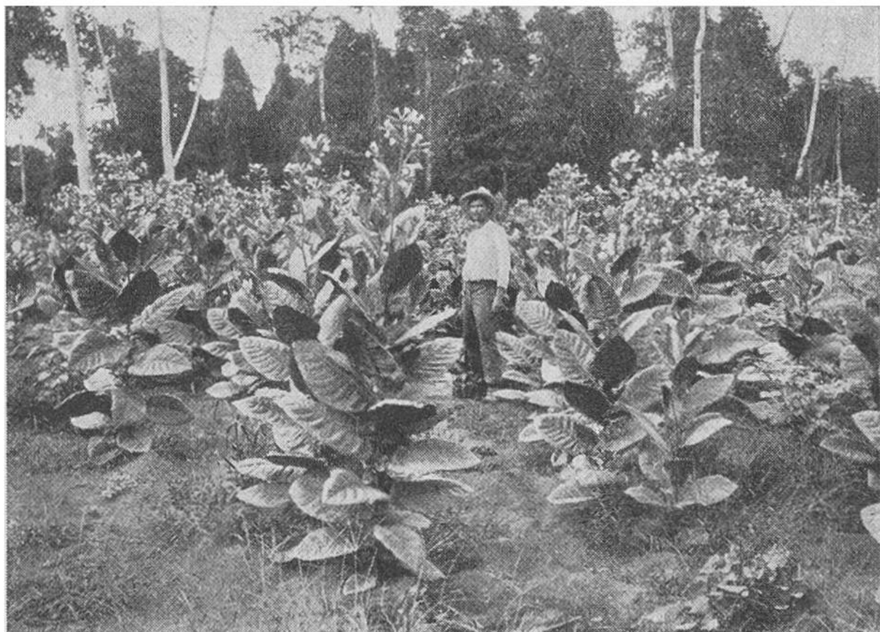
Eine Tabakpflanzung auf der Insel Cuba.

Plantagen mit einem etwa 3 m hohen Zelt überdeckt. Es bedeutet dies eine gewaltige Arbeit; doch sie lohnt sich reichlich durch die bessern Preise, die für den Tabak erzielt werden. Auch das sorgfältige Ernten der Blätter, das Trocknen und die Beeinflussung der stets eintretenden Gärung durch entsprechende Luftzufuhr sind sehr wichtig, um eine milde, aromareiche Qualität zu erhalten.