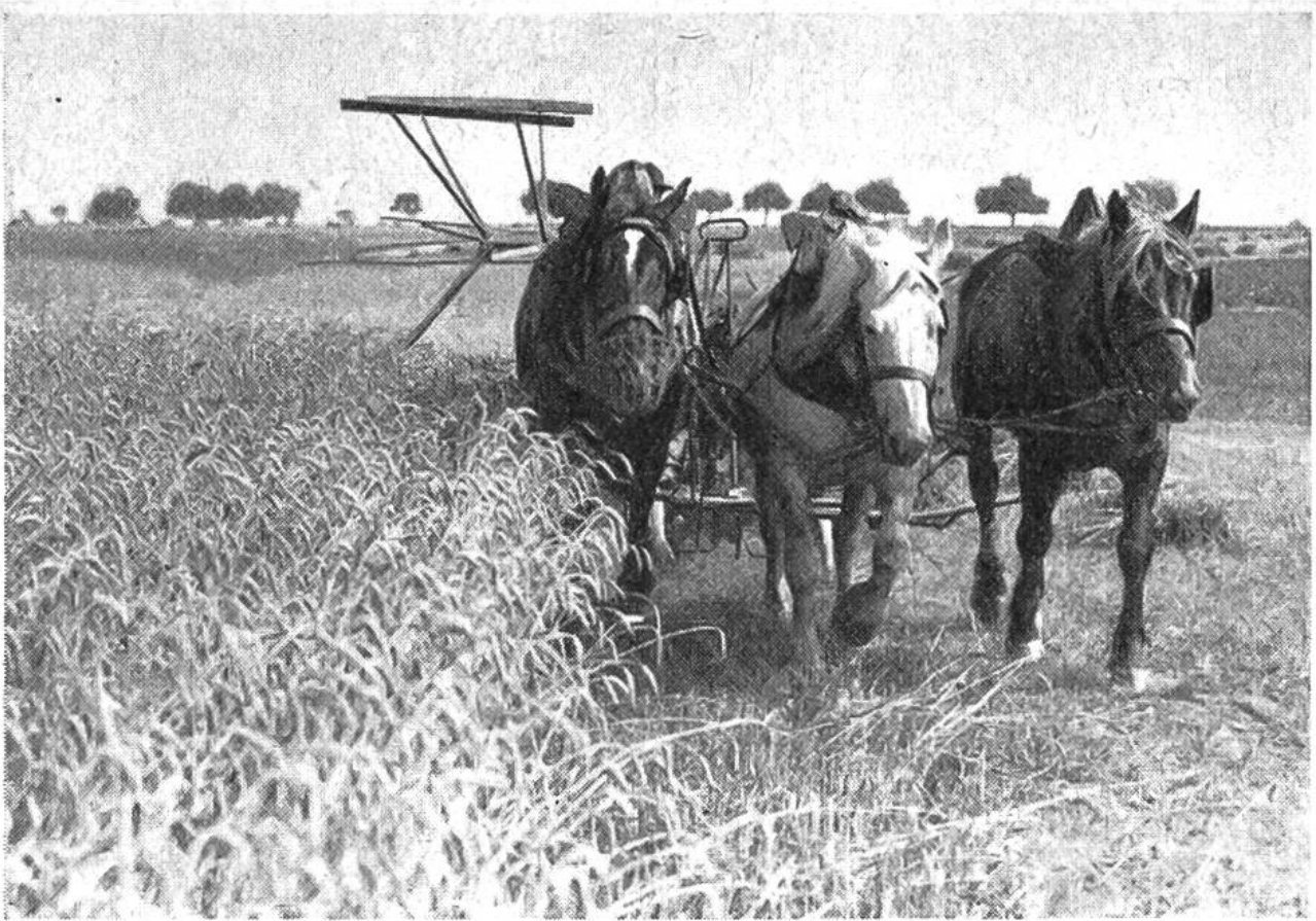
Erntezeit! — Der von drei kräftigen Pferden gezogene Getreidebindemäher bei der Winterweizenernte.

mechanischen Einrichtungen in Gewerbe und Industrie. Viele an sich kostspielige Geräte werden oft nur während weniger Tage im Jahreslaufe gebraucht. Aus diesem Grunde gewinnt in der kleinbäuerlichen Landwirtschaft die gemeinschaftliche Maschinenhaltung zur Erzielung eines besseren Nutzergebnisses der Arbeit und einer tragbareren Kostenverteilung erhöhte Bedeutung. Die ersten Versuche zur Technisierung der einst mühseligen und wenig ergiebigen Landarbeit sind nicht viel mehr als 100 Jahre alt. Im Sommer 1831 erstellte im nordamerikanischen Staate Virginia ein einfacher Farmerssohn, namens Cyrus Hall McCormick, in der zum väterlichen Gute gehörenden Schmiede nach vielen erfolglosen Versuchen die erste brauchbare Getreidemähmaschine. Der erst 22jährige Erfinder ahnte wohl kaum, welche umwälzenden Folgen seine wohldurchdachte Konstruktion auf die Gestaltung der neuzeitlichen Landwirtschaftstechnik haben werde. Die Nachfrage nach der zeit-