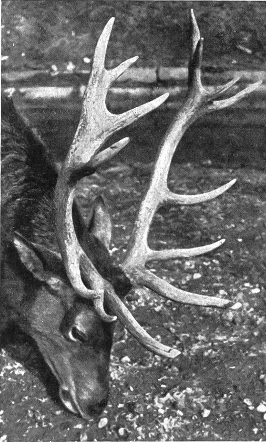
Derselbe Hirsch mit fertig ausgebildetem, gebrauchsfähigem Geweih (Vierzehnder).

nämlich aus abgestorbenem Knochenmaterial. Das Geweih ist also gefühllos. Nur während des Wachstums, wenn es noch vom „Bast“ überzogen ist, besitzt es Leben und Empfindung. Nach dem Abschälen des Bastes, nach dem sogenannten Fegen, stirbt das ganze Knochengebilde ab; das Leben zieht sich daraus bis in die Rosenstöcke zurück. Hier liegt eine seltsame Grenze zwischen Totem und Lebendem. Das ist jedoch nicht das einzige Wunder des Geweihs.