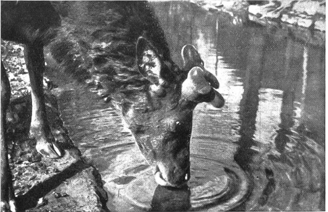
Kolbenhirsch, wenige Wochen nach dem Abwurf des alten Geweihs.