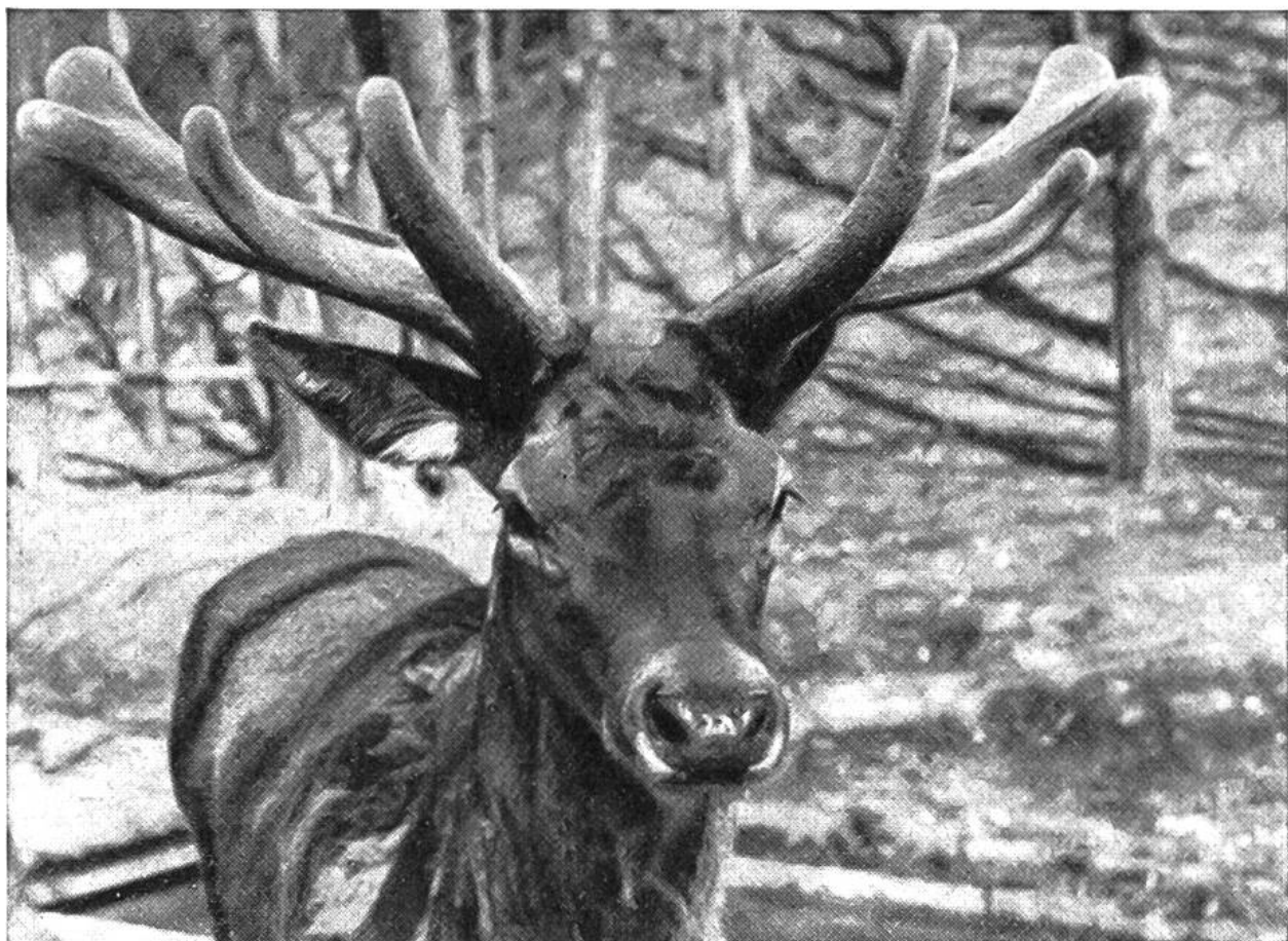
Typischer Basthirsch. Das Geweih ist noch nicht fertig „vereckt“, d. h. die endgültige Endenzahl kann aus diesem Stadium noch nicht ersehen werden.

Männchen ein Geweih aufsetzt, wie das übrigens auch für die anderen Hirsche mit Ausnahme des Rentieres gilt. In seinem ersten Lebensjahr wird der Junghirsch „Spiesser“, d. h. sein Geweih (Erstlingsgeweih) besteht auf jeder Seite des Kopfes nur aus je einem spitzen Dolch, sozusagen aus einem Knochenspiess. Im darauffolgenden Jahr kann dieser Spiesser bereits ein „Sechser“ werden; seine Endenzahl kann also von einem Jahr aufs andere von 2 auf 6 schnellen, unter Umständen sogar auf 8. Jedenfalls ist es nicht zutreffend, dass jedes Jahr genau je ein neues Ende dazu kommt. Wenn der Hirsch voll ausgewachsen ist, kann er mehrere Jahre nacheinander ein Geweih mit gleicher Endenzahl ausbilden, und wenn er den Gipfel seiner Lebenskurve überschritten hat und Alterserscheinungen sich geltend machen, „setzt der Edelhirsch zurück“. Dieser Weidmannsausdruck will besagen, dass der alternde Hirsch von Jahr zu Jahr ein geringeres Geweih ausbildet. Unter Umständen