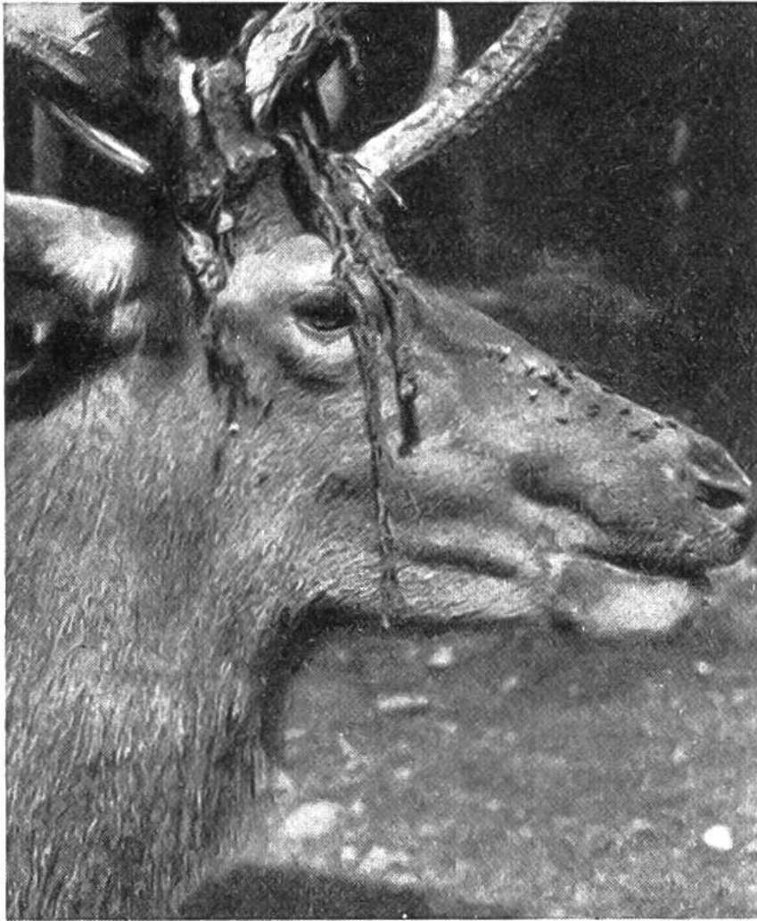
Hirsch während des „Fegens“; die blutigen Bastfetzen hängen ihm lästig ins Gesicht.

sind es am Schluss, ähnlich wie beim Jungirsch, nur noch grosse Spiesse.