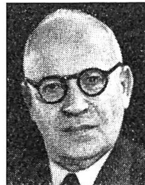
Ernst Nobs von Zürich * 1886, seit 1944 im Amte Finanz-, Zolldep.