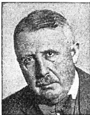
Eduard v. Steiger von Bern * 1881, seit 1941 im Amte Justiz-u. Polizeid.