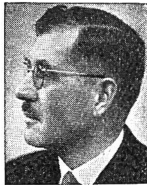
Dr. Karl Kobelt von Marbach (St. G.) * 1891 seit 1941 i. Amte Militärdepartem.