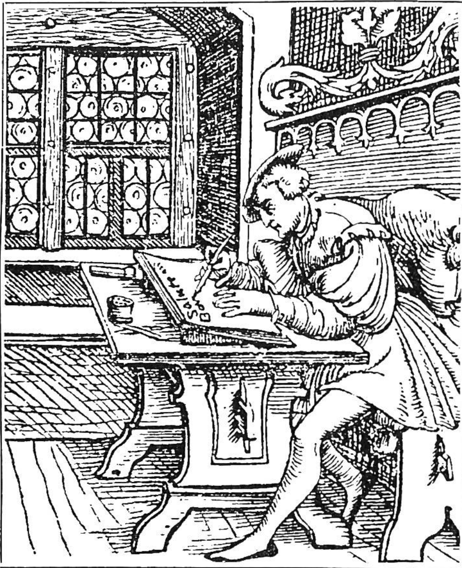
Schreiber an der Arbeit. Holzschnitt aus dem 16. Jahrhundert.

Engelberger Schreibstube unter dem Abt Frowin (1143—87) entfaltete eine fruchtbare künstlerische Tätigkeit. Die Buchmaler des Klosters Einsiedeln pflegten besonders die farbige Ausschmückung der handgeschriebenen Bücher. Die Anfangsbuchstaben einer Seite oder eines Kapitels wurden immer mehr hervorgehoben. Das blieb nicht ohne Einfluss auf die spätere Rechtschreibung. Das Großschreiben der Anfangsbuchstaben, das in andern europäischen Schriften nicht angewendet wird, ist auf jene Sitte zurückzuführen. Unter den mittelalterlichen Schreibstätten und Bibliotheken der Stadt und Landschaft Zürich nahmen das weltliche Chorherrenstift zum Grossmünster in Zürich und die Benediktinerabtei zu Rheinau durch hervorragende Leistungen den ersten Platz ein.