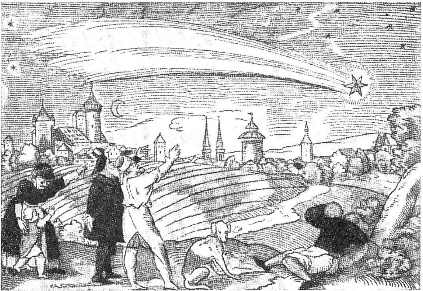
Darstellung einer Kometenerscheinung aus dem Jahre 1577.

dass die Kometen eine Massenanhäufung kleiner Himmelskörper darstellen; die Masse eines Kometen dürfte aber schätzungsweise nicht mehr als den 100 000. Teil der Erdmasse betragen.