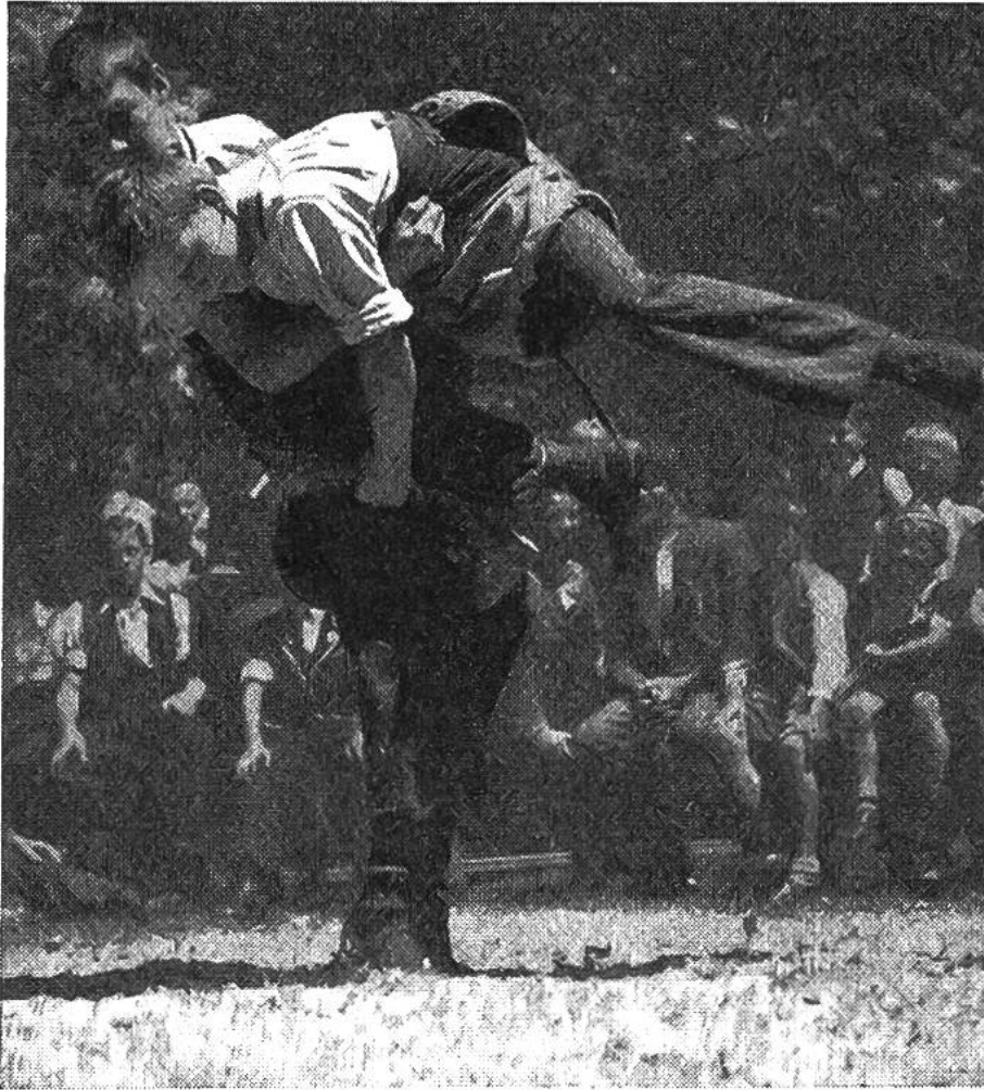
Mit festen Griffen, wie die geübten Schwinger, fassen die Buben an. Selbst in dieser kritischen Stellung werdendie umgeleiteten Schwinghosen d. Gegners nicht losgelassen.

bühr: wer mitmachen will, meldet sich bei der Einteilung der Paare. Die Knaben schlüpfen in die zwilchenen Hosen der älteren Schwinger und vollführen mit kunstgerechten Griffen den „Hosenlupf“. Manchen Schwung haben sie durch aufmerksames Zuschauen bei grossen Schwingfesten gelernt, und mit äusserster Anstrengung versucht jeder der jungen Schwinger, den Sieg im harten Zweikampf zu erringen. Jung und alt hat sich auf dem sonnigen Festplatz eingefunden und verfolgt mit grösster Aufmerksamkeit das im aufstäubenden Sägmehl ringende Paar. Es ist schwer festzustellen, wer stärker vom Zuschauerfieber erfasst wird, ob die alten Emmentaler Schwinger, welche als Preisrichter amten, oder die auf den Kampf wartenden Buben. Bis die zahlreichen Paare ihre Runden beendet haben und die Sieger aus dem heissen Wettkampf hervorgegangen sind, ist der Vormittag vorbei. Nun folgt die von allen sehnlichst erwartete Stunde der Preisverteilung, die das Fest abschliesst. Die ersten Preisträger wer-