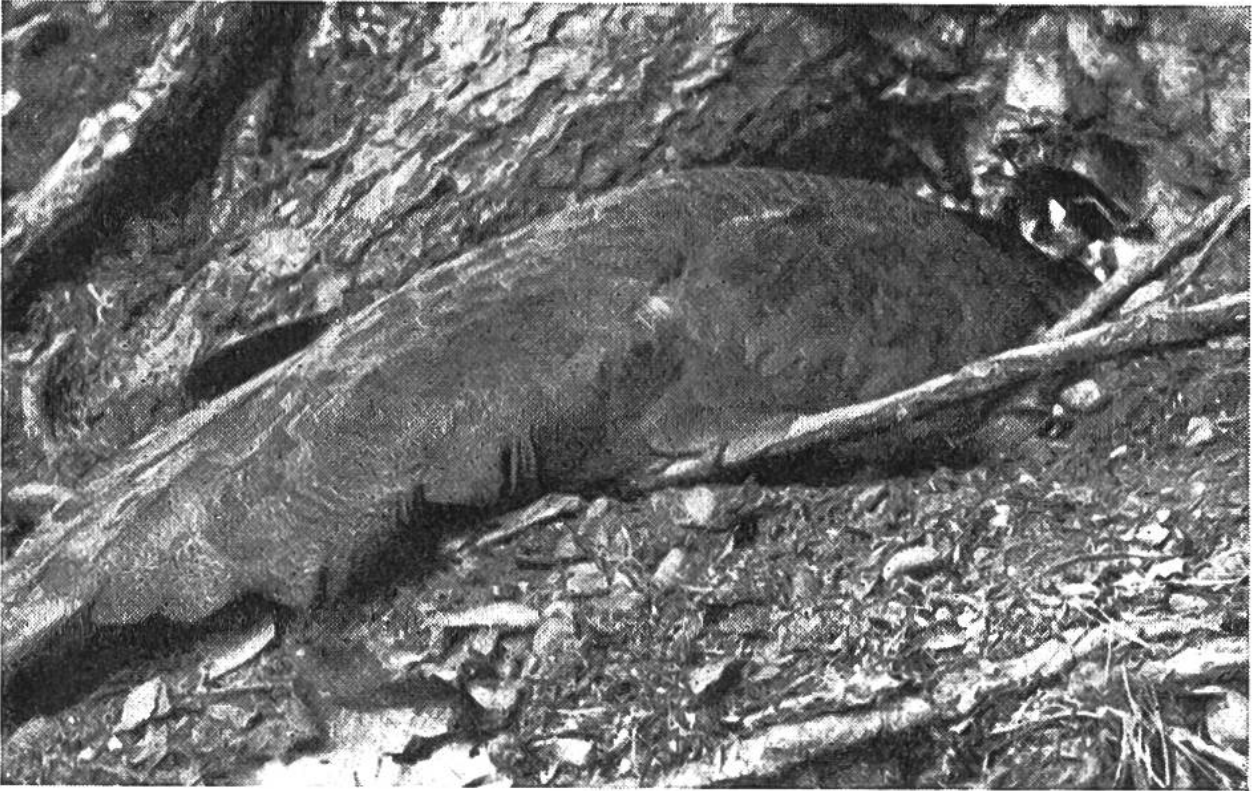
Brütende Pfauhenne. Das einfache Braun und Grau ihres Gefieders ist eine ausgezeichnete Schutzfärbung, so dass sich der Vogel kaum von der Unterlage abhebt.

sich keinen Horst hoch oben über den Boden, um ihre grossen Eier hineinzulegen, sondern legt sie irgendwo zwischen dürren Blättern und vermodernden Zweigen auf die blosse Erde, mit Vorliebe am Fusse dicker Baumstämme zwischen starken Wurzelabzweigungen.