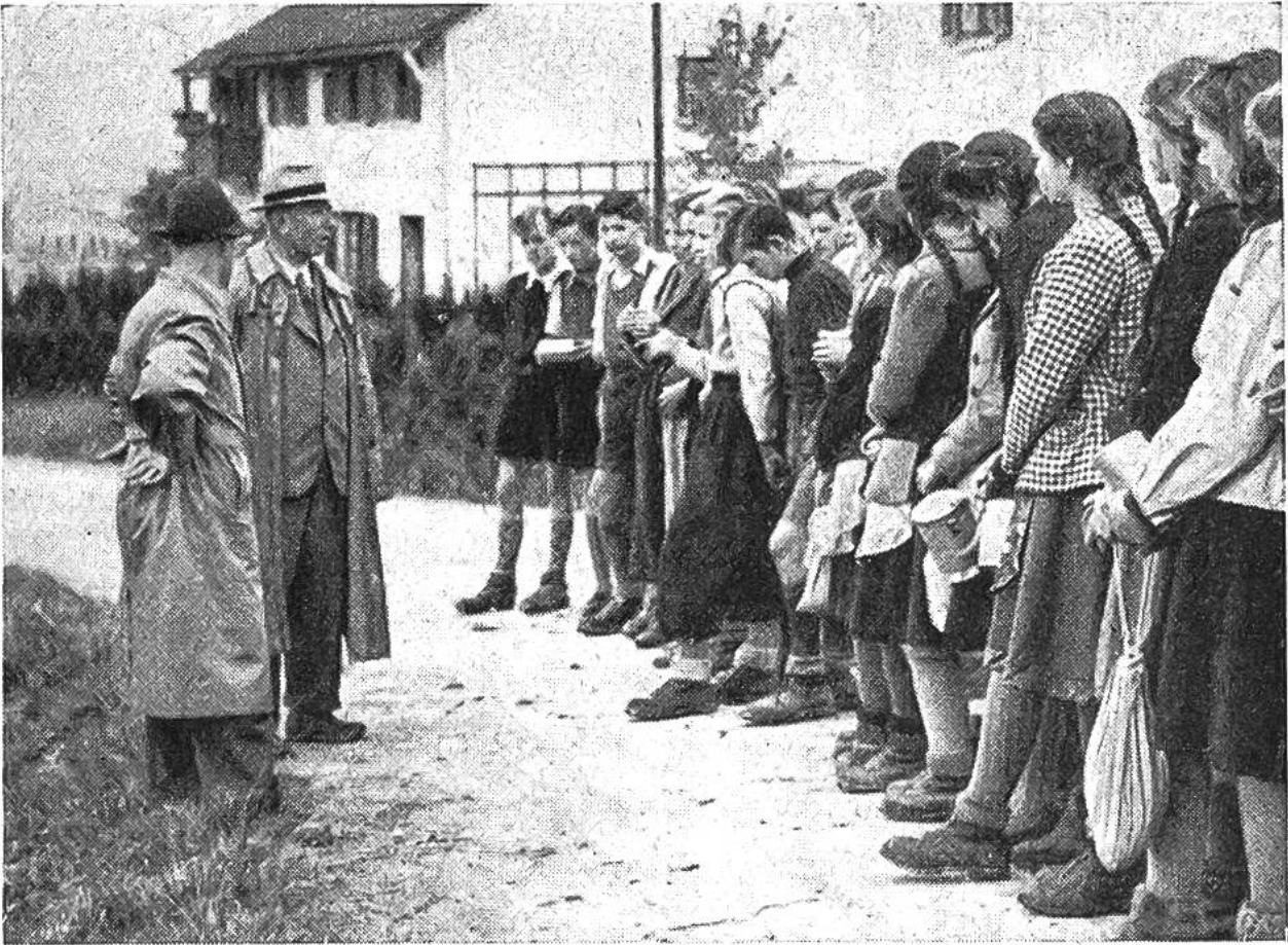
Die Sekundarschülerklasse einer Zürcher Aussen- gemeinde „einsatzbereit zur Jagd auf den Händöpfelfeind“. Lehrer und Ackerbauleiter geben die letzten Anweisungen.

Stück an die Unterseite der Kartoffelblätter. Nach etwa einer Woche schlüpfen daraus die rotgefärbten Larven, die unter ständigem Fressen innert 14 Tagen bis 12 mm gross werden und sich dann 15—20 cm tief im Boden verpuppen. Nach weitem 10—12 Tagen kriechen die fertigen Käfer aus, und der Kreislauf beginnt von neuem. Infolge dieser ausserordentlichen Vermehrungsfähigkeit und Fressgier des Schäd- lings können ganze Kartoffelfelder in kurzer Zeit kahl- gefressen werden, wenn die Bekämpfung nicht rechtzeitig einsetzt. Die natürlichen Feinde des Kartoffelkäfers, wie die Vögel, die Larven des Marienkäferchens, verschiedene Schreitwanzen usw., richten bei plötzlichem massenhaftem Auftreten des Käfers nicht viel aus.