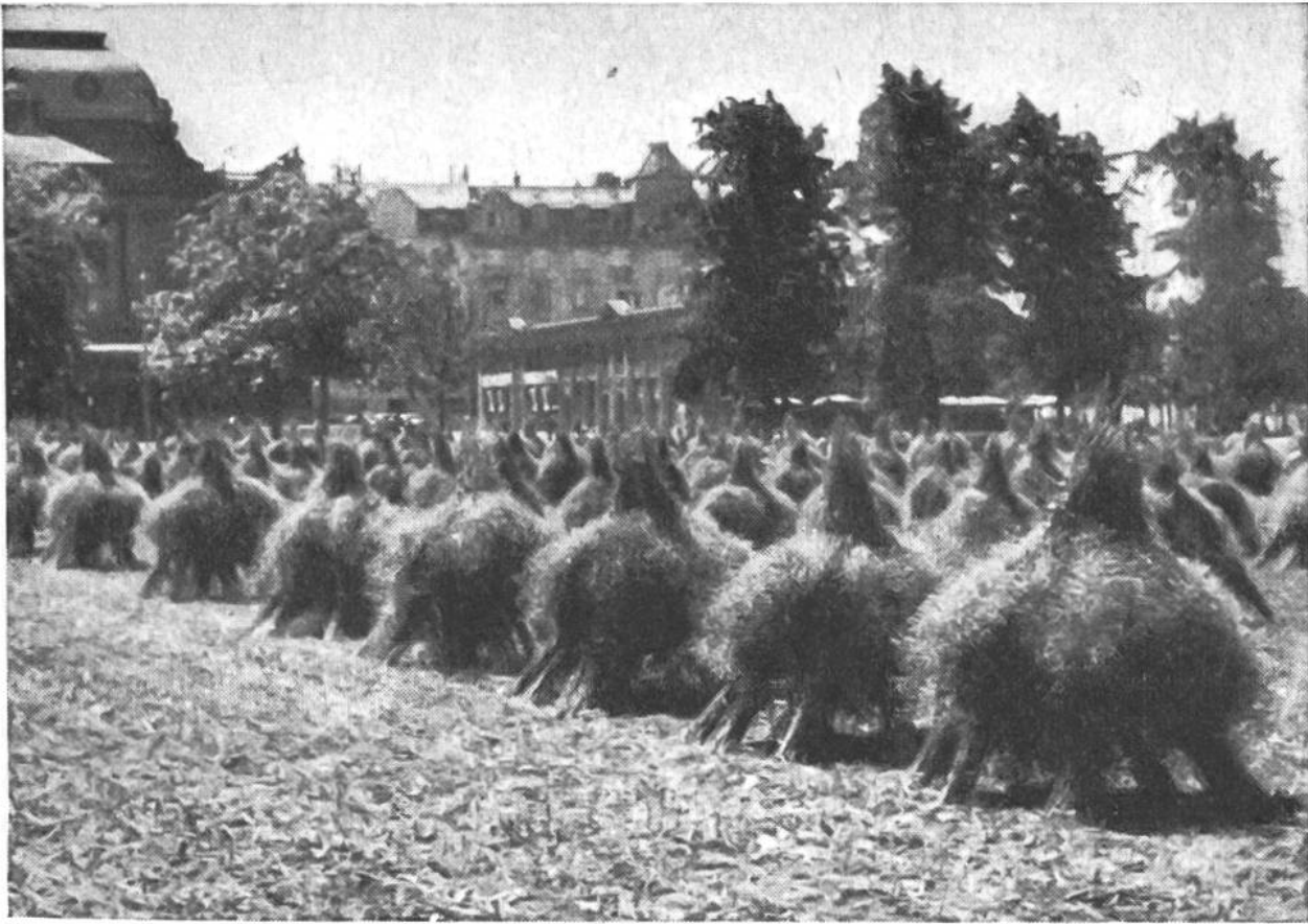
Rapserte in der Großstadt! Aus Rapsgärbchen erstellte „Doppelhocken“ auf dem alten Tonhalleplatz in Zürich.