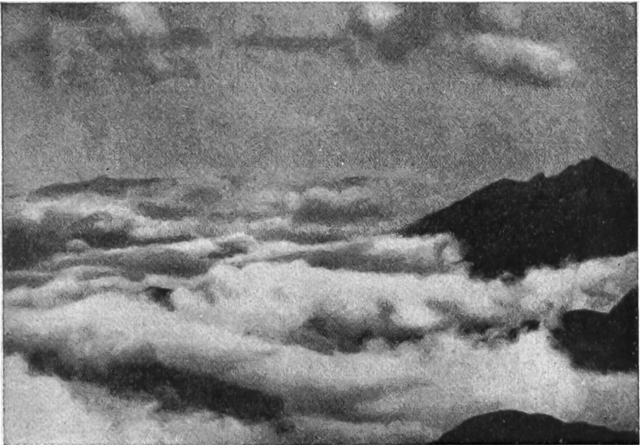
Wolkenmeer in den Bergen.

Wolkenmassen überdeckt; als Klippen ragen die Bergzacken von Fels und Schnee aus der brauenden, wogenden Tiefe. Bewunderung und Andacht erfüllen den Einsamen in diesem grossen Frieden hoch über den hastvollen Städten und in der Nähe des Himmels. Weh ihm aber, wenn er selbst auf unsicherem Pfad von den schleichenden Wolkenfetzen überrascht wird und ohne Sicht als Verirrter den Gefahren der Bergwelt entrinnen muss!