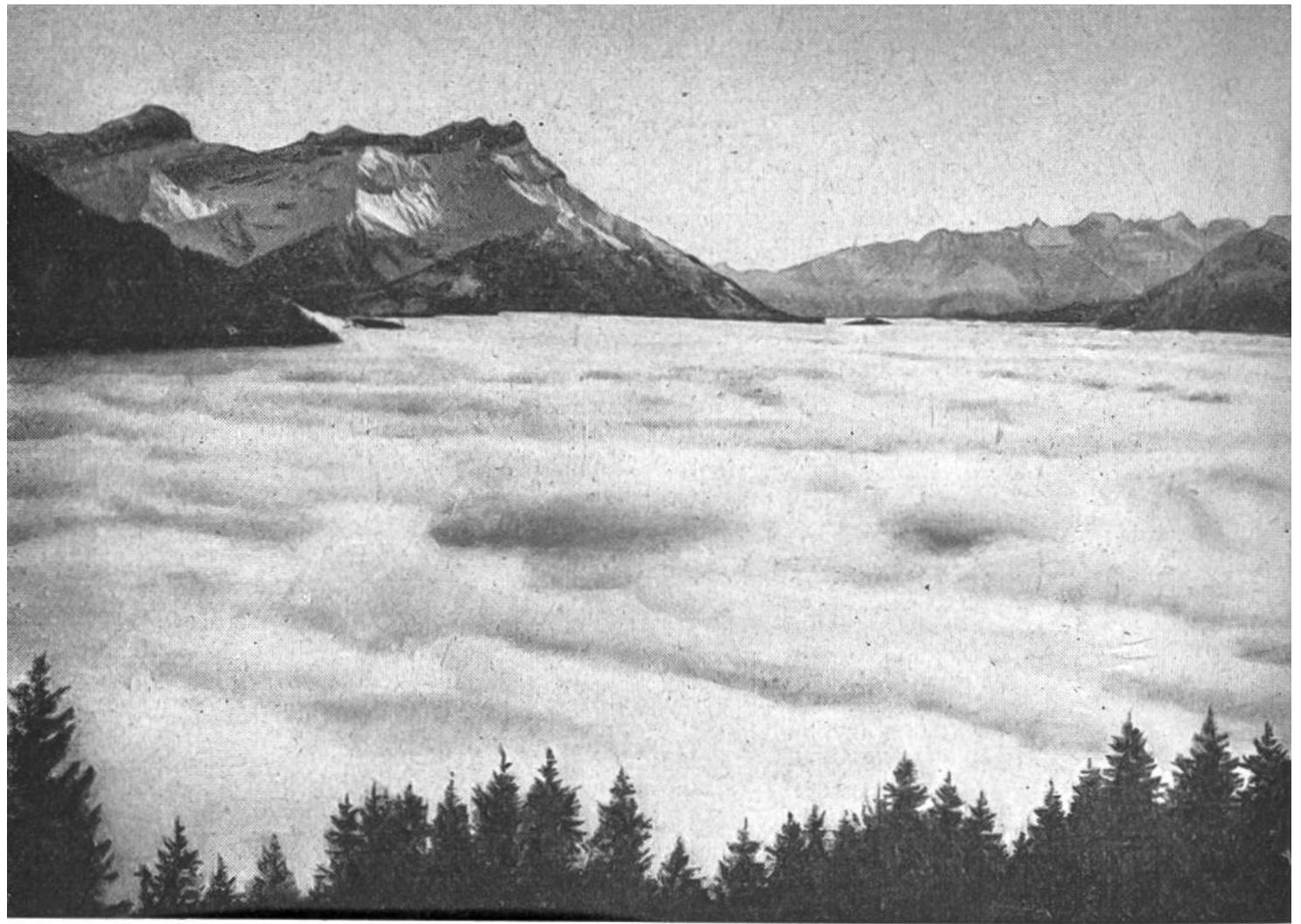
Nebelmeer im Rhonetal. Ausblick von Leysin.