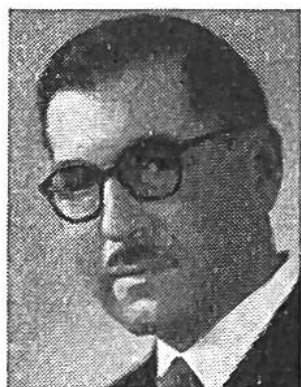
Dr. Karl Kobelt von Marbach (St. G.) * 1891 seit 1941 i. Amte Militärdepartem.