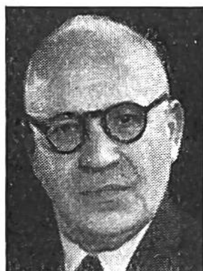
Ernst Nobs von Zürich * 1886, seit 1944 im Amte Finanz-, Zolldep.