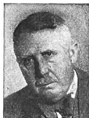
Eduard v. Steiger von Bern * 1881, seit 1941 im Amte Justiz-u. Polizeid.