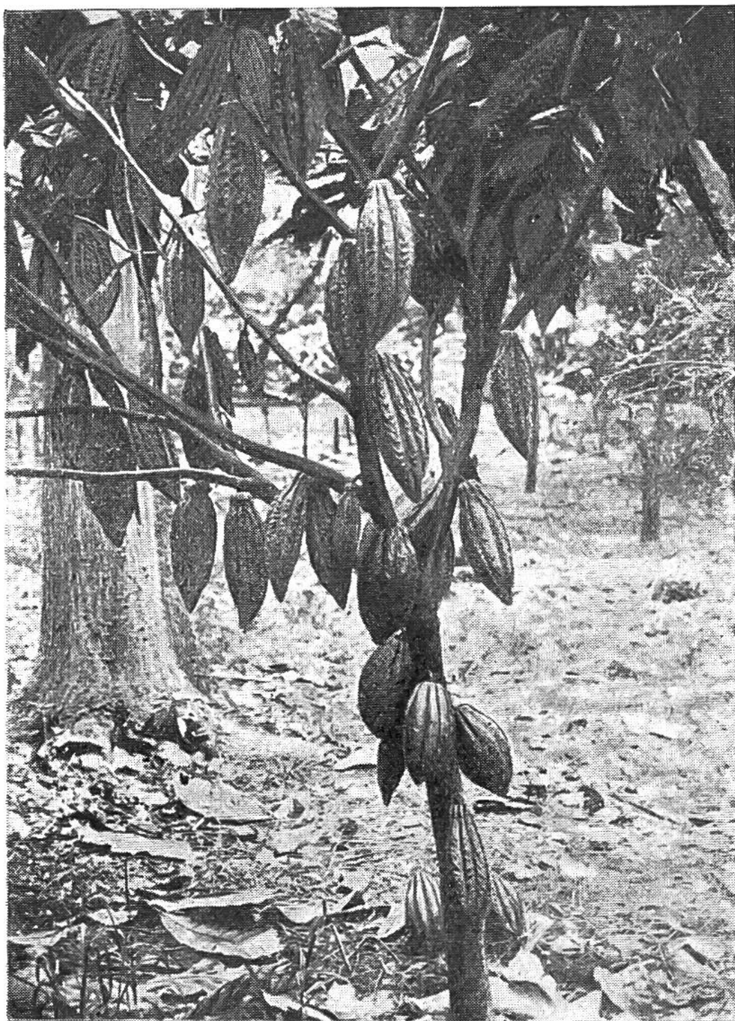
Die ersten verwendbaren Früchte des Kakaobaums erscheinen nicht vor dem 4. Jahr; im 12. Jahr erreicht der Baum seine höchste Kraft.

kaoernte blieb stets derselbe: Vom Stamm der 5–8 Meter hohen Bäume werden die wie rote Gurken aussehenden Früchte abgelöst, entzweigeschnitten und die 30–40 Samenkörner aus dem weichen, weisslichen Fruchtfleisch genommen. Diese Samenkörner sind die Kakaobohnen, die an der