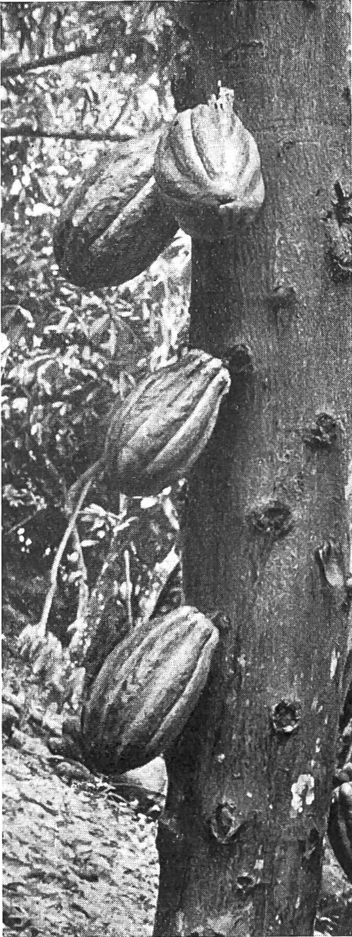
die Narben erkennen lassen, schon mehrmals abgeerntet worden ist.

sengenden Sonne der tropischen oder subtropischen Zone ausgelegt und gedörst, dann nach Bedarf geröstet und gemahlen werden. Während die einfacheren Schichten des mexikanischen Volkes dem mit Wasser abgekochten Bohnenextrakt sehr viel Maismehl und roten Pfeffer beifügten, würzten die vornehmeren Familien das immer kalt genossene Getränk mit Vanille, Ahornsafft oder süßem Honig.