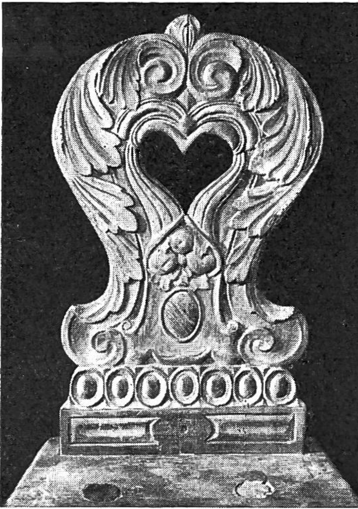
Toggenburger Schnitzerei: Eine Stabellen-Lehne aus dem 18. Jahrhundert.

in welchem Vorräte an Wäsche und Lebensmitteln, z.B. von Fruchtschnitzen, aufbewahrt wurden – waren beliebte Möbelstücke und eigentliche Vorgänger des Schrankes. Auf allen Seiten wurden diese grösseren und kleineren Kästen mit grosser Farbenfreudigkeit bemalt. Dass mit dem Pinsel auch vor den Bettstellen nicht haltgemacht wurde, beweisen die bemalten Bettladen. Es gibt noch in heutiger Zeit hie und da eine in vielen Farben leuchtende oder mit Schnitzwerk versehene doppelschläfige Himmel-