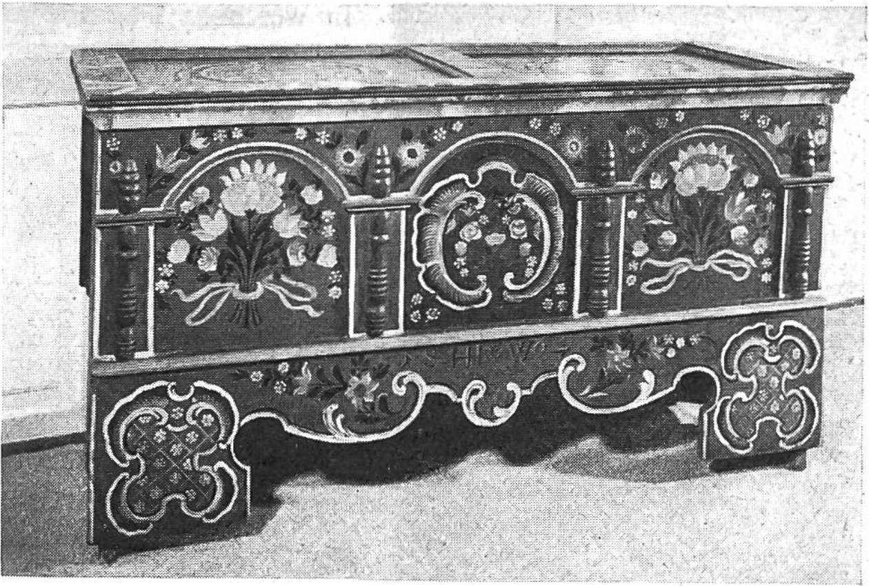
Diese schöne handgemalte Truhe aus dem Jahre 1804 steht im Appenzellerländchen.