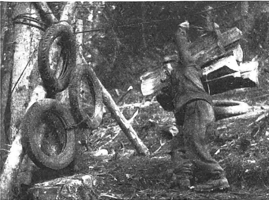
Die primitiv eingerichtete Talstation einer Seilbahn. Dieser Mann trägt im Tag nicht weniger als 50 Tonnen Holz, die Nutzlast von 5 Eisenbahnwagen, auf seinem Rücken weg.

das aus diesem zähen Bergholz gewonnene Kochmittel erhalten. Hoch oben an steilen Hängen, über schwindligen