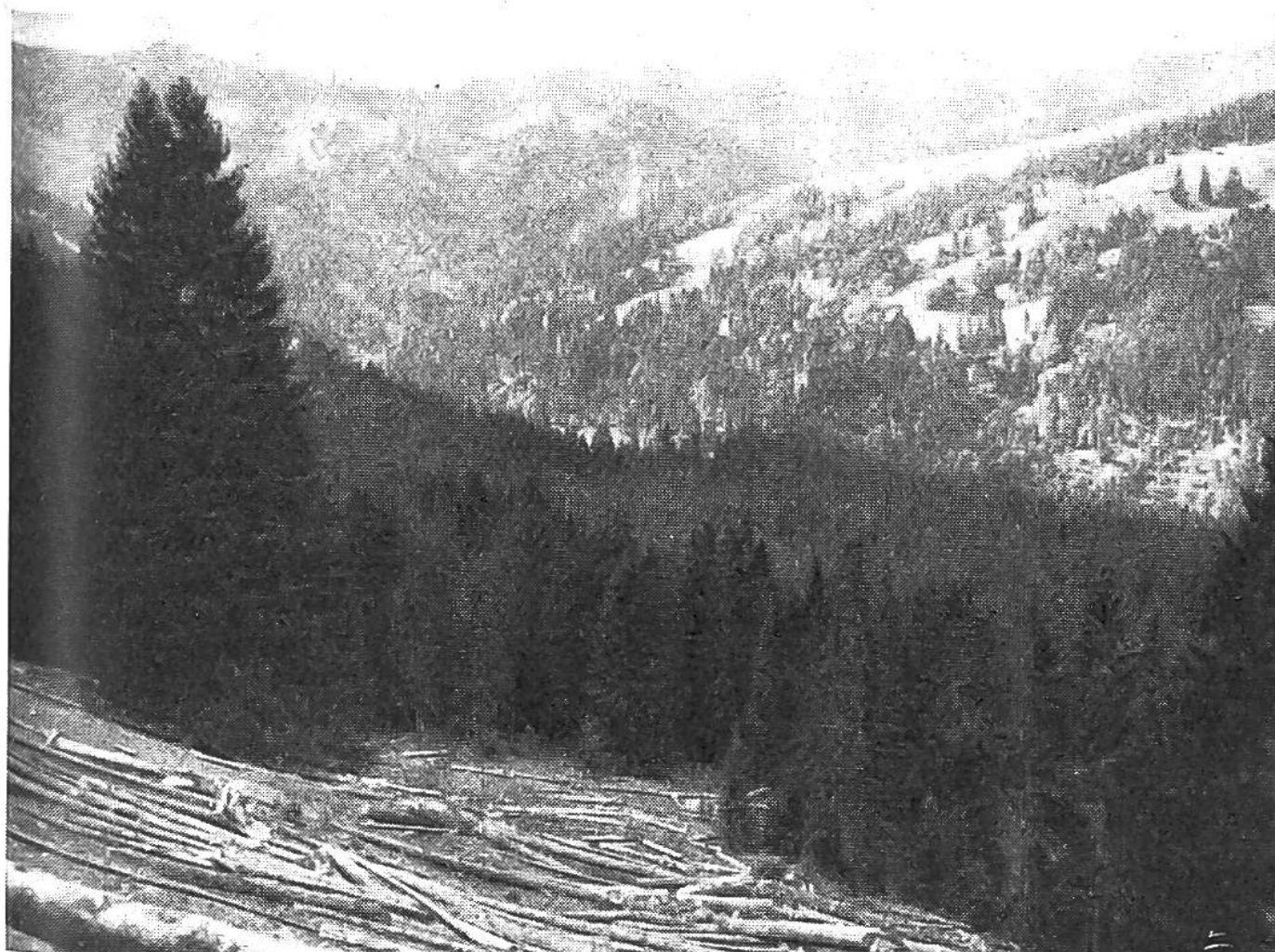
Das den Hang hinunter „gereisete“ Bergholz wartet auf den Weitertransport nach der Talstrasse.