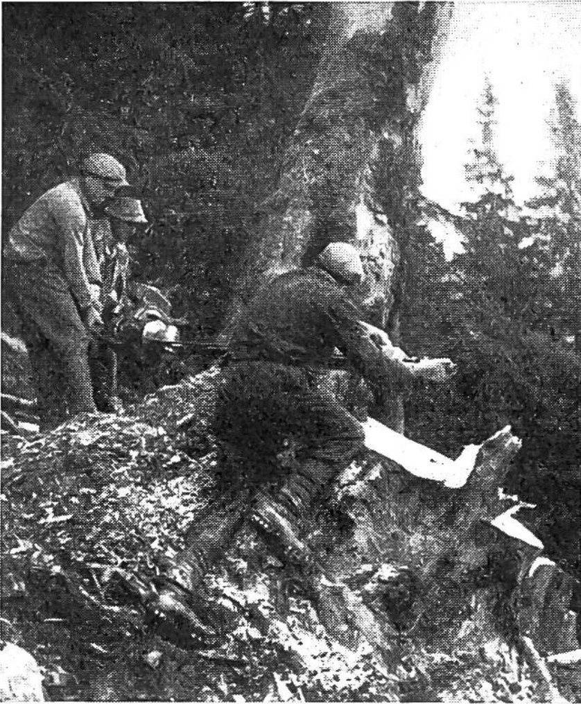
Die Motorsäge leistet beim Fällen der uralten Waldriesen gute Dienste.

Unserem Schweizerwald wurde in den verflossenen Jahren viel zugemutet. Seine Erzeugnisse trieben 6731 Holzgasautos und 5637 Holzkohlengasautos; sie versorgten zahllose Lokomotiven, Maschinen, Fabriken, Schulhäuser, Spitäler und Haushaltungen mit Brennholz; der Wald lieferte dem an Zementmangel leidenden Baugewerbe das notwendige Bauholz, den Papierfabriken viele hunderttausend Ster Papierholz und zu guter Letzt den städtischen Gaswerken das Gasholz als verlässlichen Helfer in der Not. Bei einer solchen Nachfrage verwundert es keineswegs, dass die Kriegswirtschaftsämter den öffentlichen und privaten Waldbesitzern die Verdoppelung ihrer jährlichen Holzschläge vorschreiben mussten.