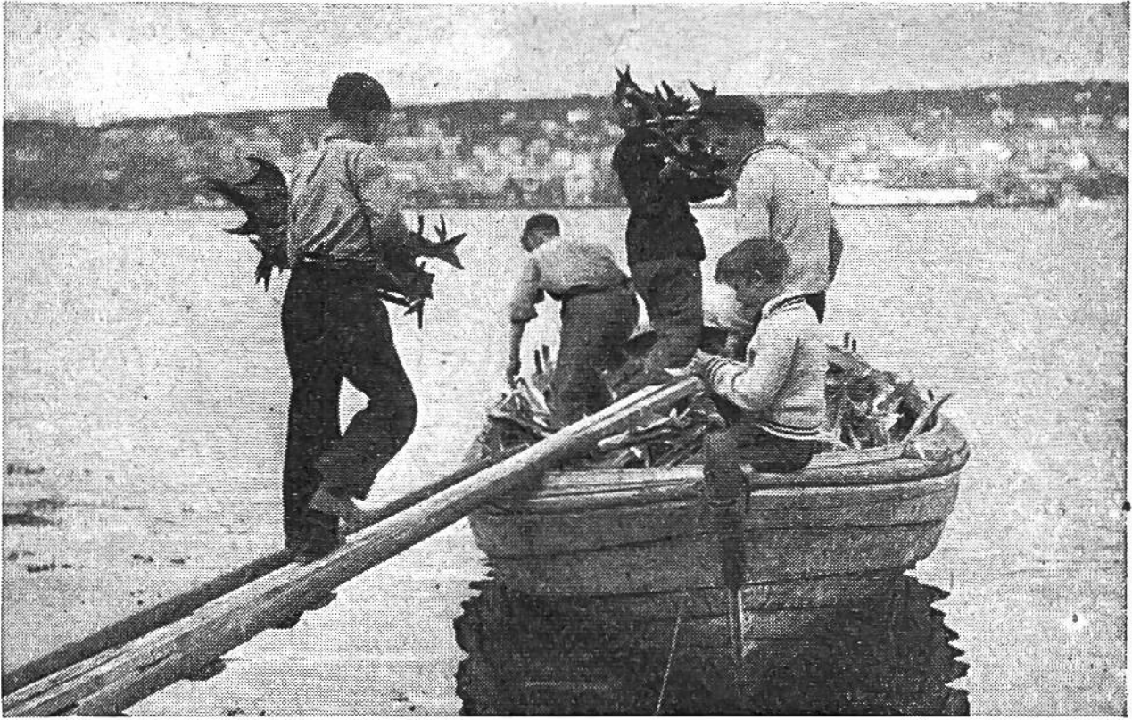
Die dünnen Dorsche werden verladen und als Stockfische in der Stadt verkauft.

Schweiz vorkommt, jedoch nur von wenigen Kennern geschätzt und gegessen wird. Äusserlich kommt diese nahe Verwandtschaft zwischen Kabeljau und Trüsche z.B. darin zum Ausdruck, dass beide am Kinn einen einzelnen, nach vorn gerichteten Bartfaden tragen.