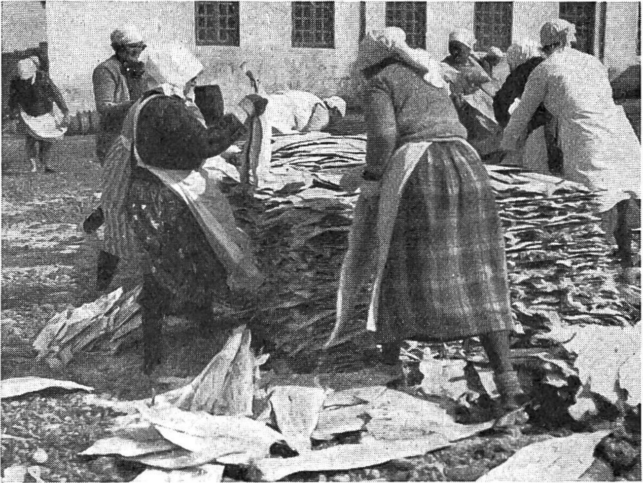
Die getrockneten Klippfische werden auf Haufen gelegt und zum Versand vorbereitet.

und der Länge nach gespalten worden ist, in riesiger Anzahl auf grossen Gestellen zum Trocknen aufgehängt und gelangt später als Stockfisch in den Handel. Erst wenn die Gestelle voll behangen sind, setzt gewöhnlich die Herstellung von Klippfischen ein. Die dazu bestimmten Fische werden nur auf der Bauchseite aufgeschnitten, gesalzen, aber nicht zum Trocknen aufgehängt, sondern auf Steinen ausgelegt. Wenn die Fische richtig dürr sind, werden sie zu Ballen zusammengeschnürt und verladen.