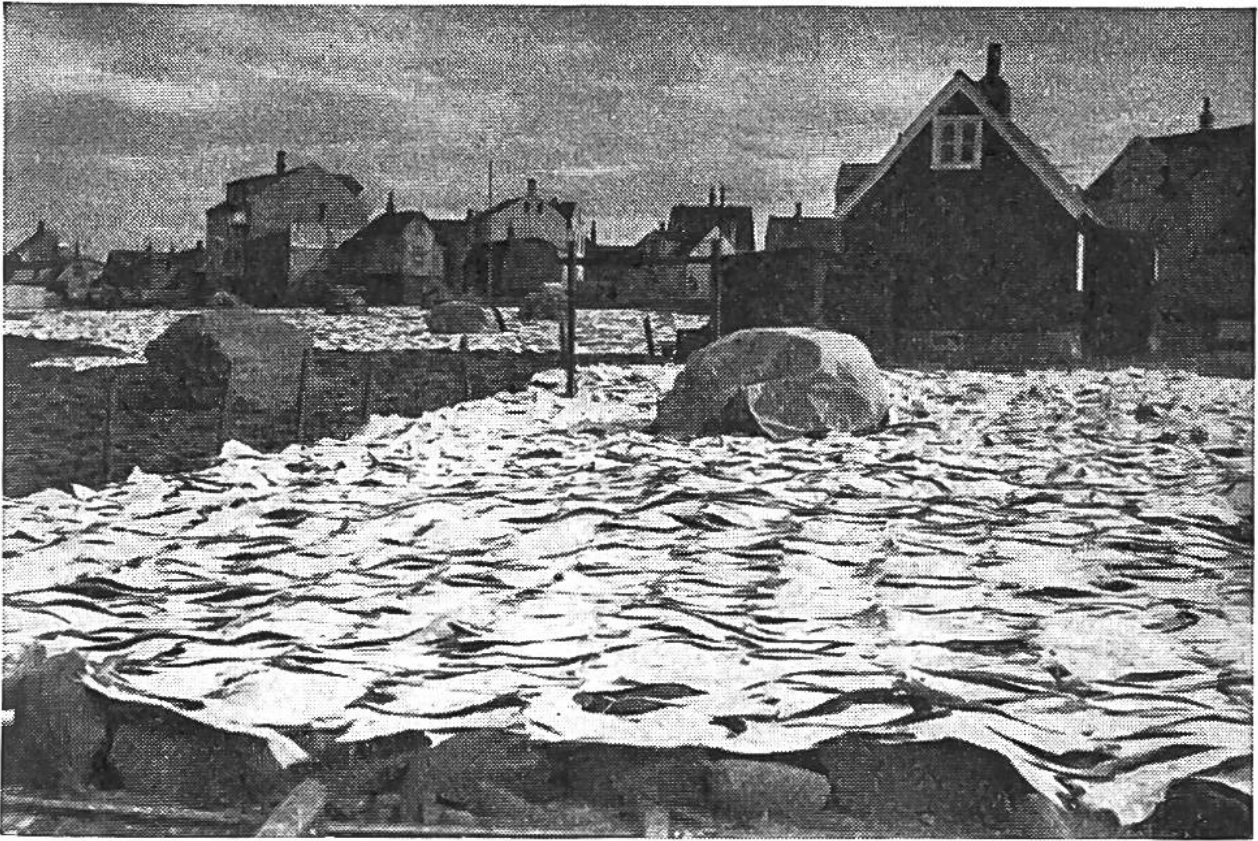
Bei der Verarbeitung der Dorsche zu Klippfischen werden die Fischkörper nicht gespalten, sondern nur geschlitzt, auseinandergelegt und in der Sonne auf Steinen ausgebreitet.