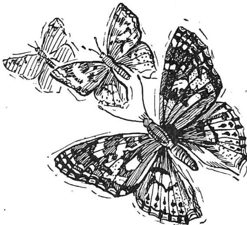
Distelfalter im Flug.

Durch jahrelanges Beobachten versucht der Mensch, die Gründe zu solchen Massenwanderungen in Erfahrung zu bringen und wenn möglich die zurückgelegten Wege zu erforschen. Ein schönes Beispiel für den Erfolg derartiger Tätigkeit bietet die Enträtselung der Flüge unserer Zugvögel. Durch „Beringung“ Abertausender der schnellen „Segler der Lüfte“ auf