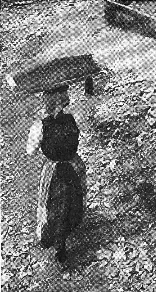
Ein Haus wird gebaut. Die Frau hilft mit, trägt Sand herbei. . .

Männern zur Gewinnung des Lebensunterhalts sogar bei den anstrengendsten Arbeiten bei. Sie schleppen Baumaterial, helfen beim Errichten neuer Häuser, nehmen am Fischfang teil, führen Transporte durch. Sie sind tapfer, fleissig und widerstandsfähig. Gern lassen sich die Männer des Südens von ihnen Arbeiten abnehmen, die zu leisten ihre alleinige Aufgabe wäre.