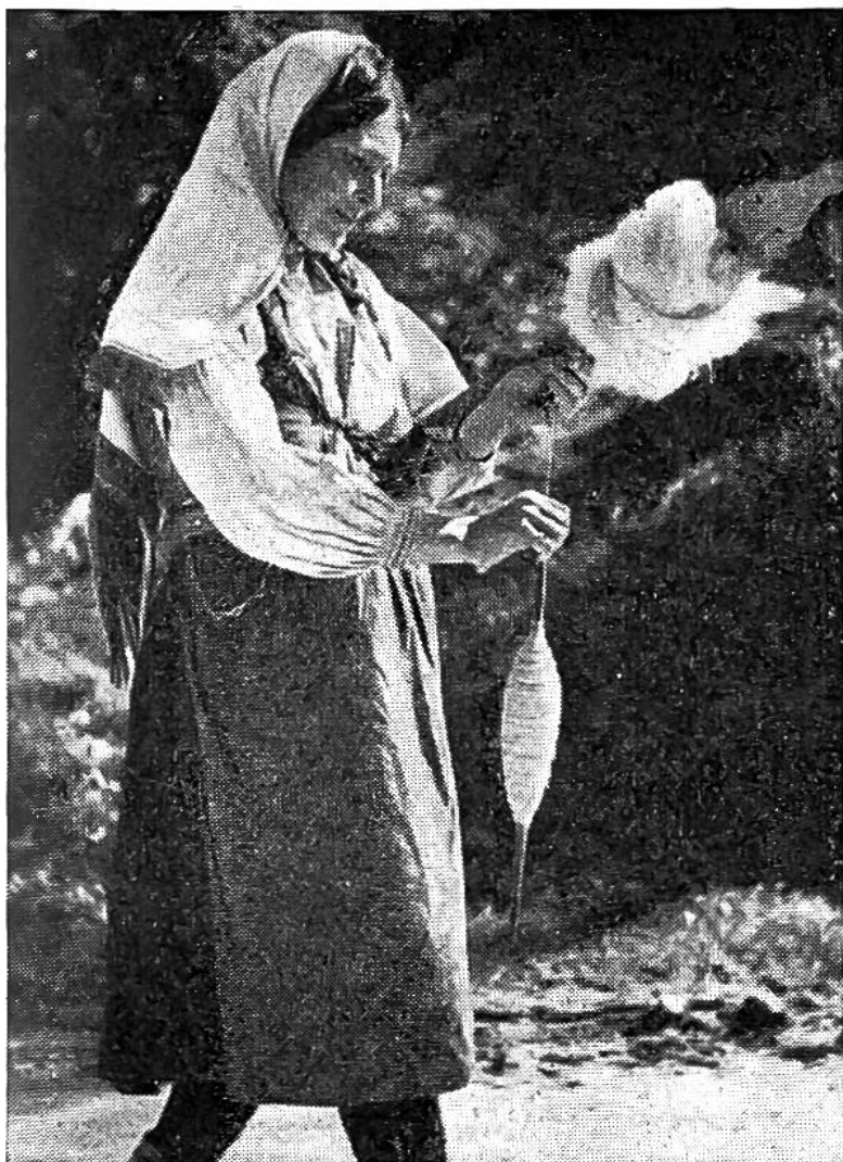
Schon auf dem Wege zur Weide spinnt die fleissige Dalmatinerin die Schafwolle vom Rocken.