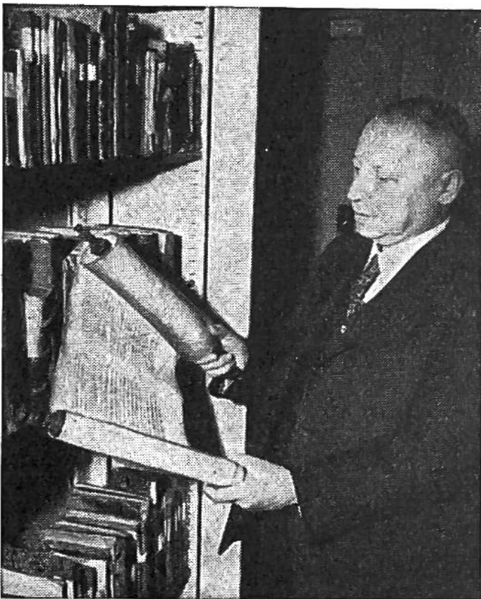
Der Leiter der hebräischen und jiddischen Abteilung liest auf einer Schriftrolle das „Buch Esther“.

Bibliotheken haben die Aufgabe zu erfüllen, die seit Jahrhunderten gedruckten und seit Jahrtausenden geschriebenen Werke der Menschen zu sammeln, vor dem Untergang zu retten und, gemeinsam mit zeitgenössischen Druckschriften, den heutigen Lesern zugänglich zu machen. Selbstverständlich berücksichtigt das Bibliothekswesen jedes einzelnen Landes in erster Linie die Leistungen des eigenen Volkes; so auch die Schweizerische Landesbibliothek in Bern. Je grösser aber die zur Verfügung stehenden finanziellen Mittel, desto umfangreicher und mannigfaltiger vermag sich die Sammlertätigkeit der beauftragten Büchereibeamten zu entfalten. Amerika, das Land der Rekorde, hat daher in weniger als 150 Jahren eine der grössten Bibliotheken der Welt zusammentragen lassen können. Die im Jahr 1800 gegründete Kongress-Bibliothek in Washington beherbergt heute rund 7 Millionen Bü-