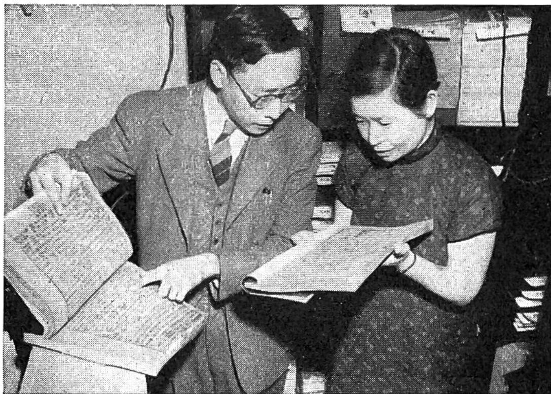
Die chinesische Abteilung birgt viele kostbare Schätze alten und neuen ostasiatischen Schrifttums.