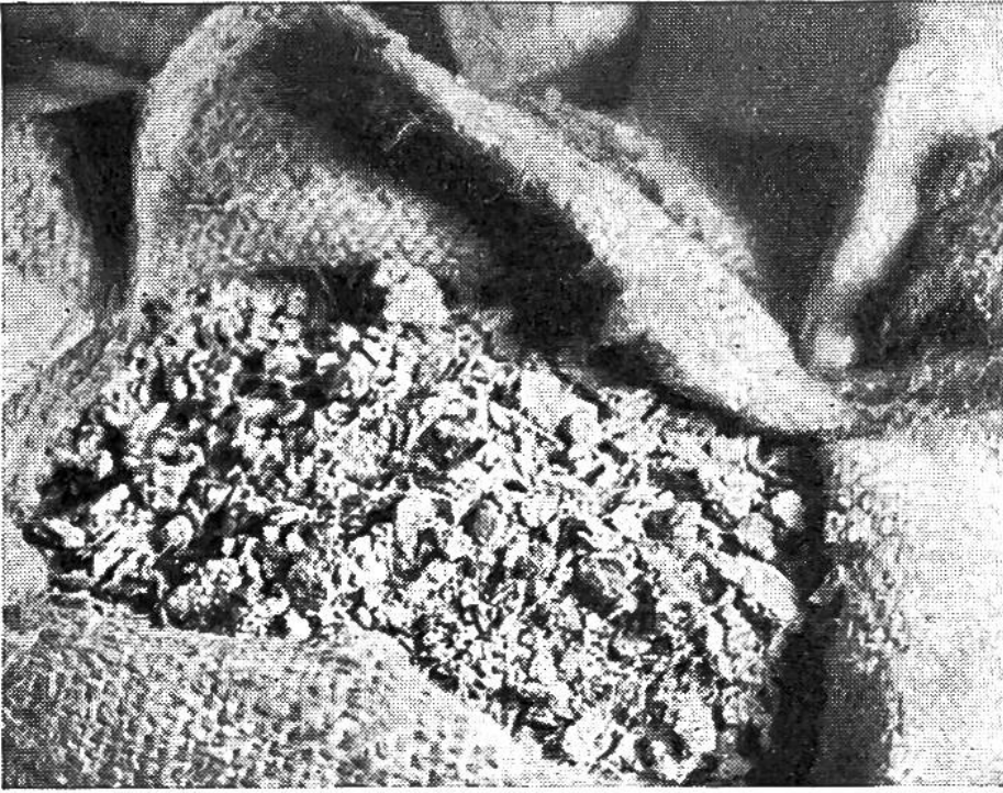
In den grössern Mostereien dörft man die Obsttrester und verkauft sie als Viehfutter.

diente zunächst die Verminderung überalterter Mostbirnbestände zugunsten gang- und haltbarer Sorten von Tafeläpfeln.