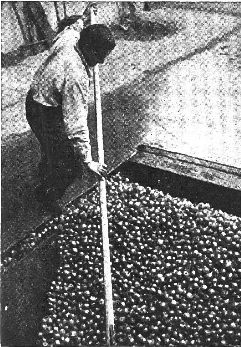
In der Mosterei wandern die Most- äpfel und Mostbirnen in den Trichter der Obstmühle.