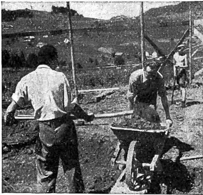
Junge freiwillige Helfer beim Ausheben der Baugrube.

Die Kinder dieses Dorfes sollen so erzogen werden, dass sie später nicht als Entwurzelte in ihre Heimat zurückkehren; deshalb schafft man sogenannte nationale Weiler, einen französischen, polnischen, ungarischen, holländischen und so fort, je nach Bedarf. Es gibt also kleine Kolonien, in denen die Kinder wohl im übernationalen Geiste Pestalozzis, aber in