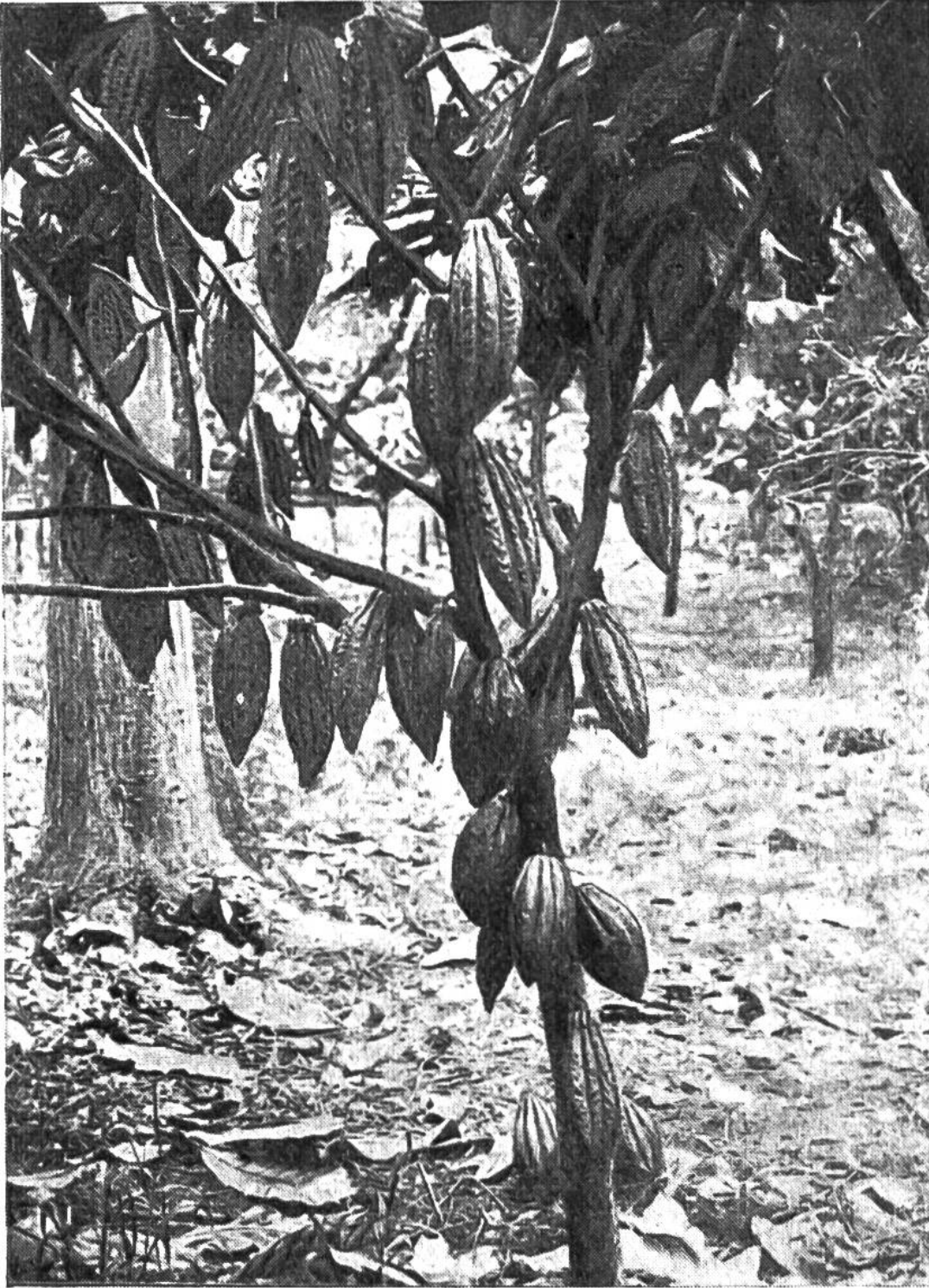
Die ersten verwendbaren Früchte des Kakaobaums erscheinen nicht vor dem 4. Jahr; im 12. Jahr erreicht der Baum seine höchste Kraft.

kaernte blieb stets derselbe: Vom Stamm der 5–8 Meter hohen Bäume werden die wie rote Gurken aussehenden Früchte abgelöst, entzweigeschnitten und die 30–40 Samenkörner aus dem weichen, weisslichen Fruchtfleisch genommen. Diese Samenkörner sind die Kakaobohnen, die an der