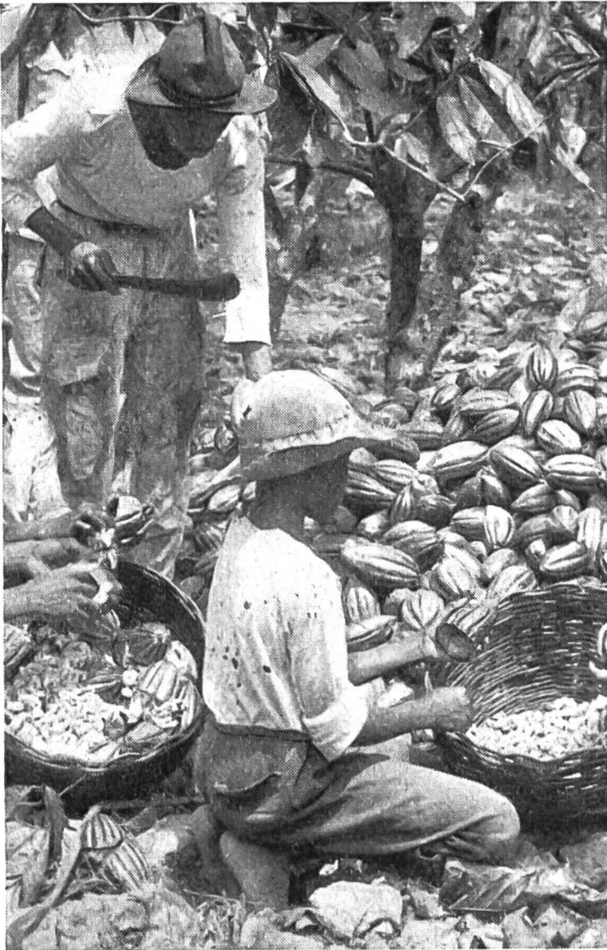
Die Kakaofrüchte werden mit einem scharfen Schlagmesser geöffnet und dann entleert.

Nach dieser Neuerung riss eine wahre Sucht nach dem Genuss von Kakao und Schokolade ein; der spanische Staat nahm das Monopol der Herstellung an sich und konnte mit grossem Nutzen das Geheimnis der Fabrikation wahren, bis es dennoch im Jahre 1606 durch den Italiener Carletti nach Italien entführt wurde. Von nun an fanden Kakao und Schokolade in vielen europäischen Ländern Eingang; sie wurden von den Ärzten als Heil- und Stärkungsmittel empfohlen und gehörten in die Salons der Vornehmen wie auf den Tisch des körperlich arbeitenden Volkes.